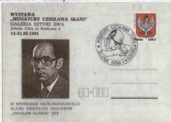
Okolicznościowa koperta nawiązująca do spotkania OKZZ „Czesław Słania” z 1994 roku.

Wystawom towarzyszyły katalogi, okolicznościowy datownik pocztowy oraz trzy koperty z różnymi nadrukami. Kuratorem obu wystaw był Janusz Milewski – przewodniczący Koła Miejskiego PZF nr 15 w Jeleniej Górze. Jednym z efektów tych wystaw była zmiana nazwy periodyku filatelistycznego wydawanego przez dzieci i młodzież z MKF im. Czesława Słania na „ Miniatury Czesława Słania ”. Było to wówczas jedyne w Polsce młodzieżowe pismo filatelistyczne, które oprócz środowisk w Polsce, docierało do Stanów Zjednoczonych, Szwecji, Danii i Australii. W trakcie tych wydarzeń filatelistycznych odbyło się także kolejne spotkanie Ogólnopolskiego Klubu Zainteresowań Znaczkami „Czesław Słania”, na które przybyli kolekcjonerzy „słanianów” z całej Polski.