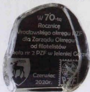
Statuetka, ufundowana przez Koło Nr 2 w Jeleniej Górze, dla Zarządu Okręgu Wrocławskiego PZF, z okazji jubileuszu.