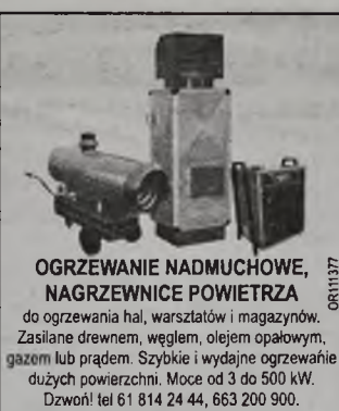
OGRZEWANIE NADMUCHOWE, NAGRZEWNICE POWIETRZA do ogrzewania hal, warsztatów i magazynów. Zasilane drewnem, węglem, olejem opałowym, gazem lub prądem. Szybkie i wydajne ogrzewanie dużych powierzchni. Moce od 3 do 500 kW. Dzwoni! tel. 61 814 24 44, 663 200 900.

NAGRZEWNICE STACJONARNE NA OLEJ, GAZ, WĘGIEL. Tanie i szybko, ogrzewanie wielokubaturowych powierzchni, hal, warsztatów i magazynów do 13 tys. m3. Dzwoni po swoją cenę! Tel. 61 814 24 44, 663 200 900.