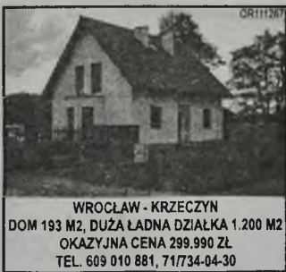
WROCLAW - KRZECZYN DOM 193 M2, DUZA LADNA DZIAŁKA 1.200 M2 OKAZYJNA CENA 299.990 ZŁ TEL. 609 010 881, 71/734-04-30

DOM wolno stojący, w Glucholazach, pow. 110 m2, komfortowy, działka pow. 828 m2 (widokowa) - 419 000 zł. Glucholazy, powiat nyski, tel. 504/00-66-46 G10HKKWP