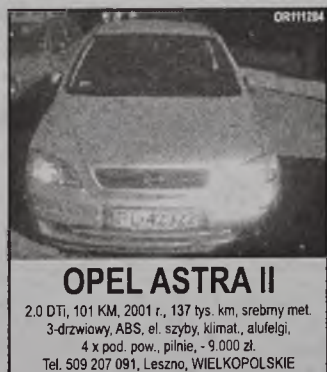
2.0 DTI, 101 KM, 2001 r., 137 tys km, srebrny met., 3-drzwiowy, ABS, el. szyby, klimat., alufelgi, 4 x pod. pow., pinie, 9 000 zł, tel. 509 207 091, Leszno, WIELKOPOLSKIE