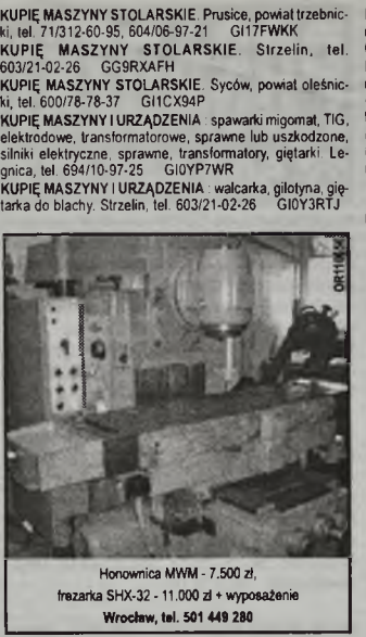
Hononica MWM 7.500 zł. frezarka SHX-32 - 11 000 zł + wyposażenie Wrocław, tel. 501 449 280