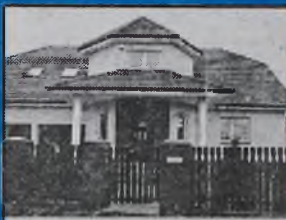
Sprzedam nowy dom w Bielanych Wrocławskich

295/1179 mkw., 20 pomieszczeń, wszystkie media, w rozliczeniu może być mieszkanie we Wrocławiu do 50 mkw. Wrocław, tel. 000/000-00-00