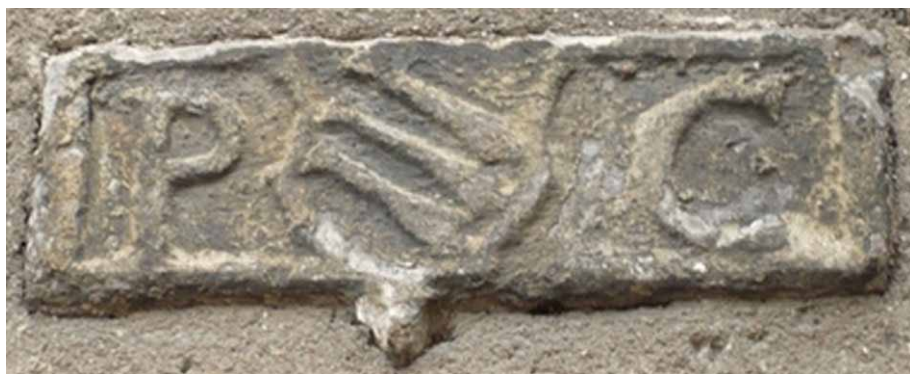
Kamienny herb na ścianie kościoła św. Erazma i Pankracego (20 cm x 13 cm). Jest to herb rodu Bolcze, Bolz (Polz). P = Polz, C = Clericus

Różne rozmiary herbu nasuwały kolejne pytania. Herb „Bolcz” był największy, herb „Schaffgotsch” o 2/3 mniejszy, a herb „Zedlitz” tylko o połowę mniejszy. Czy wielkość herbu mówi o znaczeniu tych rodów w ówczesnym czasie?