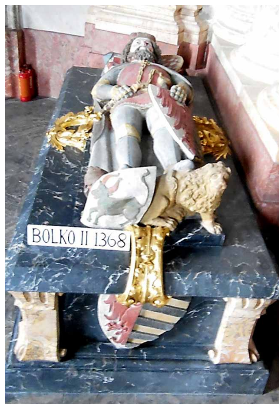
Tumba Bolka II w mauzoleum Piastów świdnicko-jaworskich w kościele klasztornym w Krzeszowie