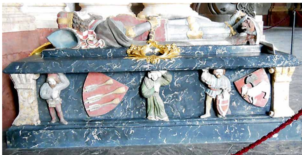
Herb na bocznej ścianie sarkofagu Bolka II Bolz Zedlitz Najstarszy herb Schaffgotsch