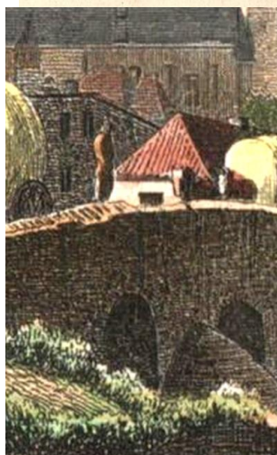
Figura św. Nepomucena na moście nad rzeką Bóbr