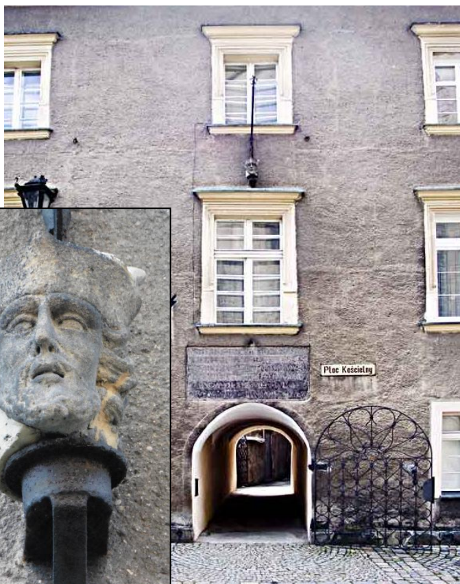
Stara głowa Nepomucena z 1709 r. na plebanii w pasażu, nad oknem.