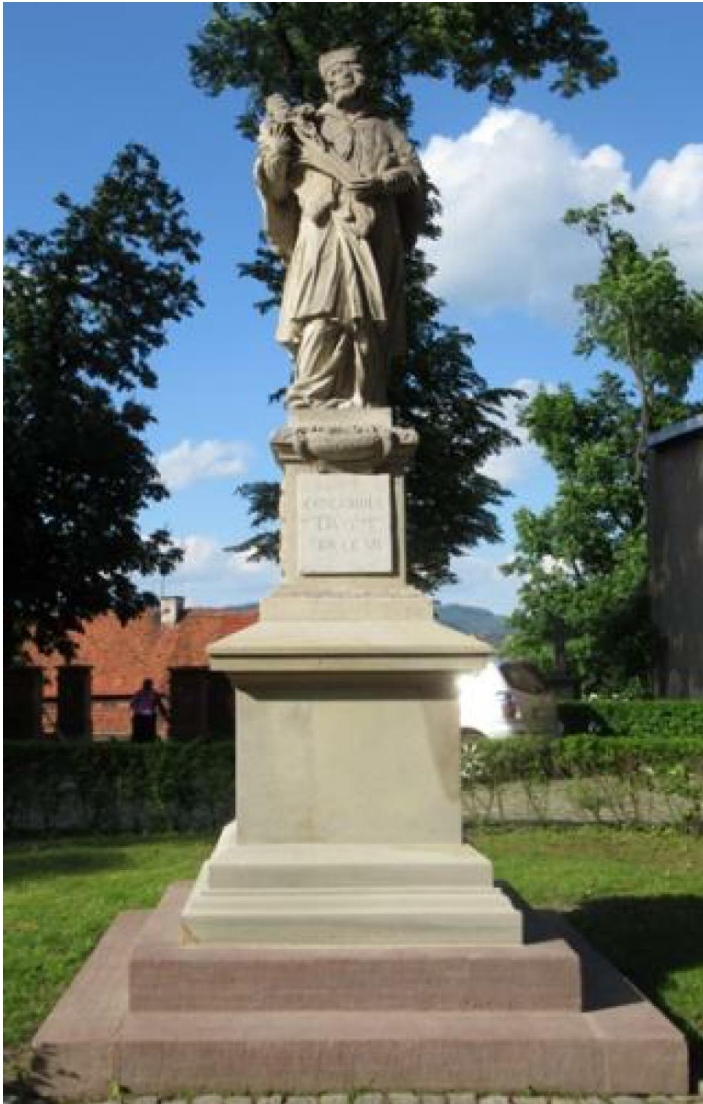
Pomnik Nepomucena na placu kościelnym św. Pankracego i Erazma