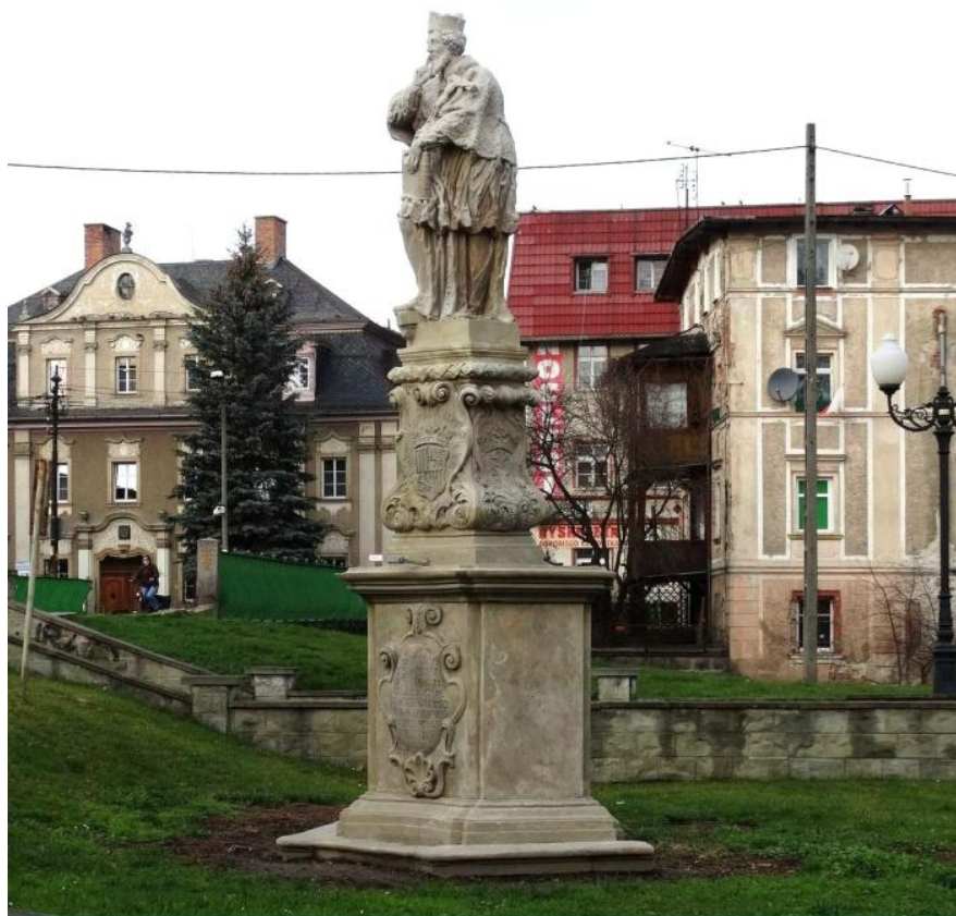
Pomnik św. Nepomucena, z lewej strony pałac Zithena 5