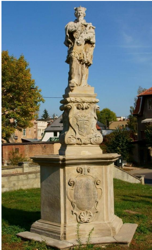
Pomnik św. Jana Nepomucena