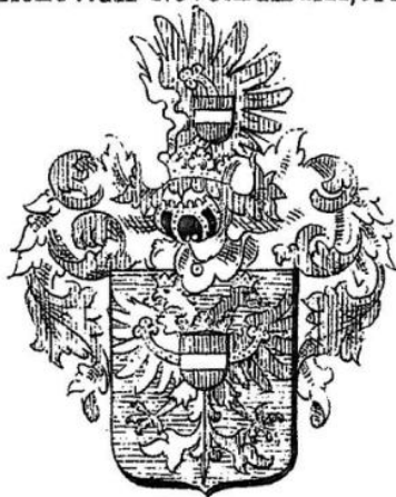
Herb hrabiów Kolovrat-Noworadski

Hans Anton hrabia Schaffgotsch był żonaty w drugim małżeństwie z Anną Teresą, hrabiną z domu Kolowrat-Krakowsky-Novoradsky (od 08. 1710, † 29. 08. 1759).