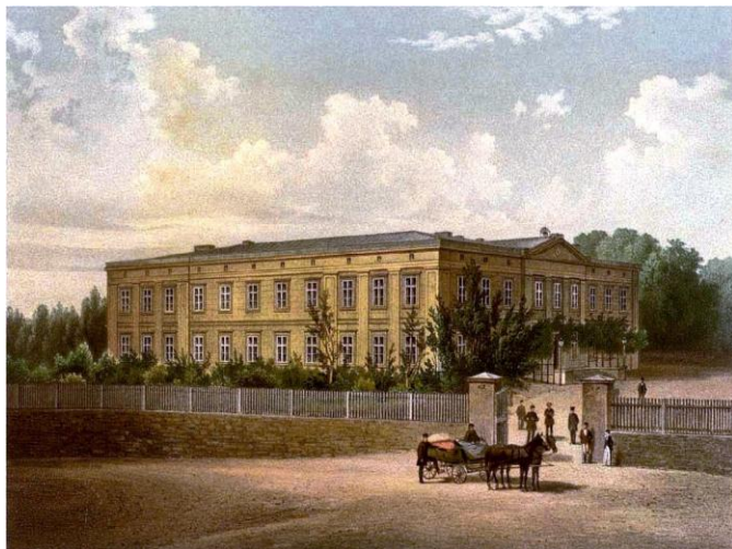
Pałac Karola Goduli w Bytomiu-Szombierkach