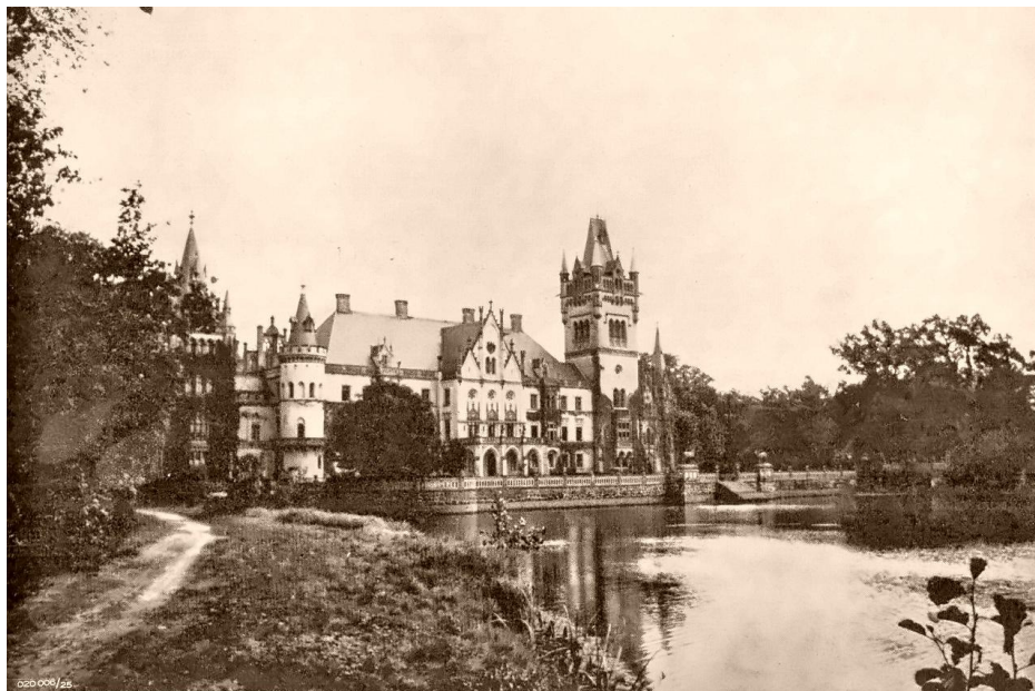
Zamek w Kopicach

Joanna wraz z mężem na rodową siedzibę wybrali zamek w Kopicach, jeden z najwspanialszych na Śląsku i razem stworzyli jeden z najbogatszych rodów Górnego Śląska. Hrabina Schaffgotsch zmarła 21 czerwca 1910 roku w Kopicach. Pochowano ją w mauzoleum rodzinnym obok miejscowego kościoła.