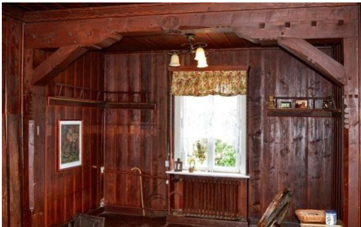
Pokój dzienny w schronisku