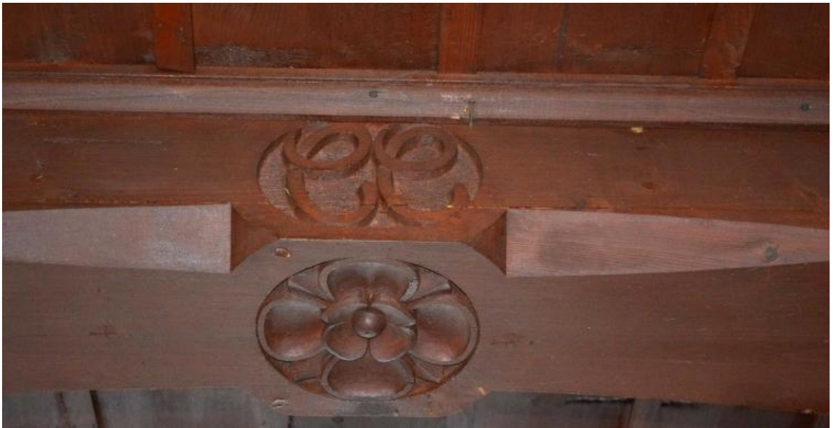
Monogram Charlotte Citron