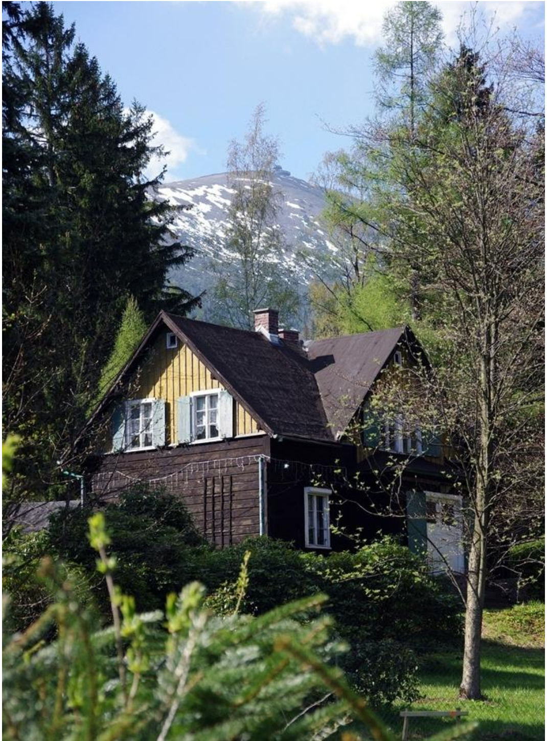
Zamek schronienia z widokiem na Snieżkę i Kopę