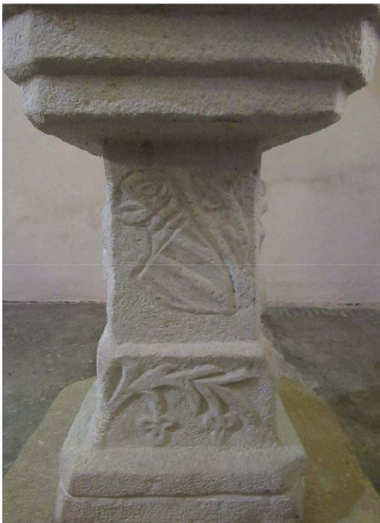
Schaffgotsch – herb