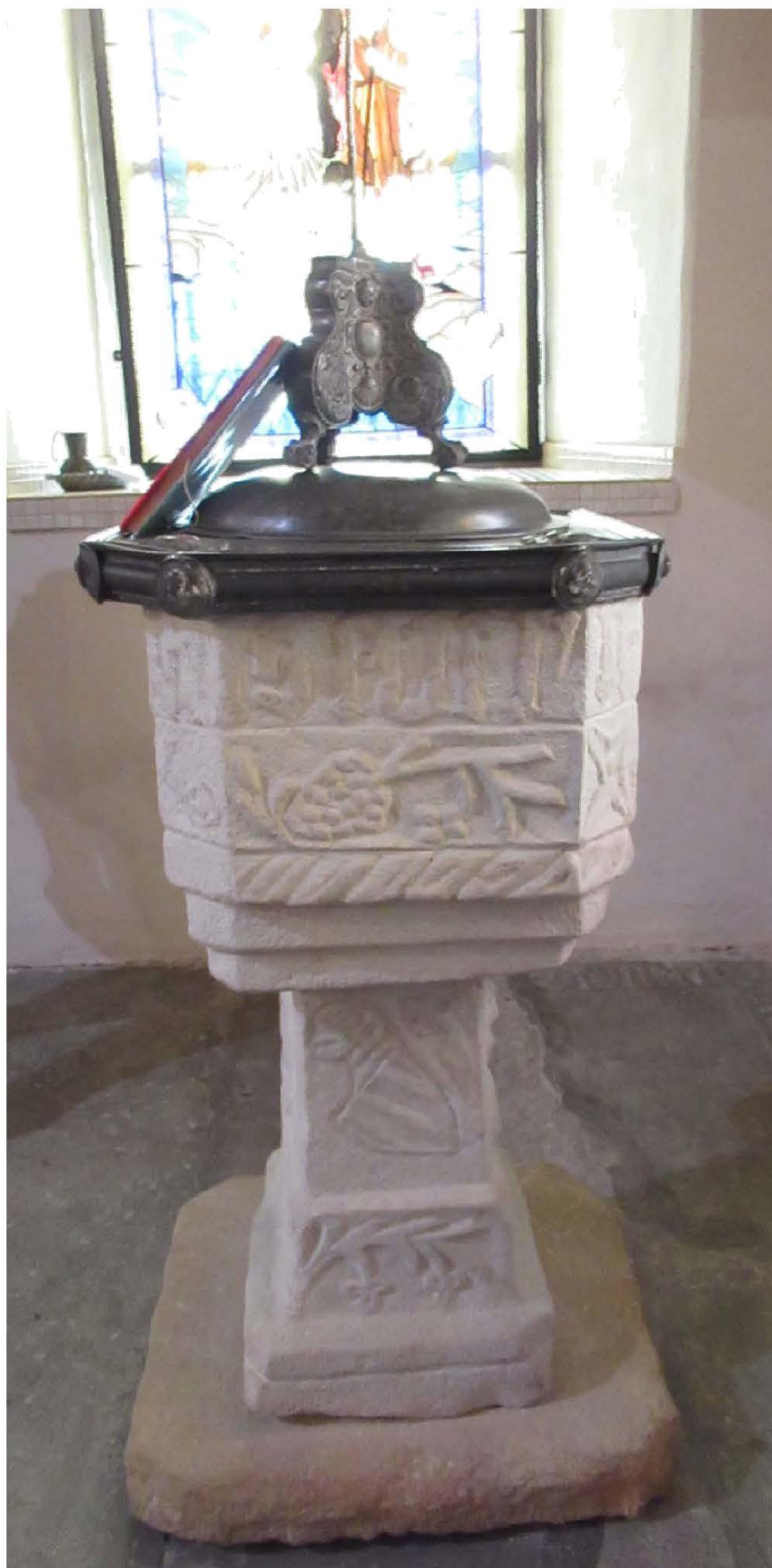
Herb hrabiów Schaffgotsch