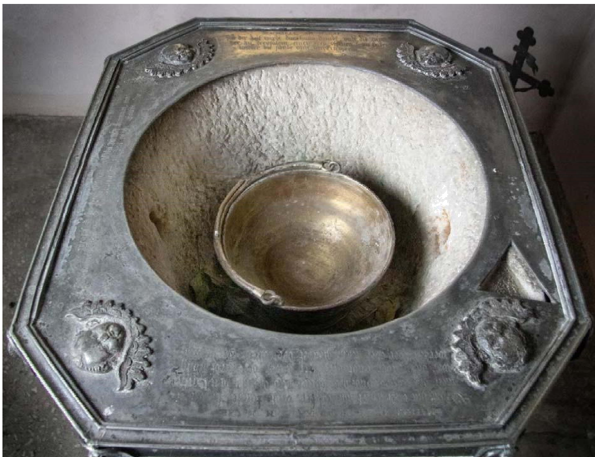
Płyta czołowa „Nakładka na misę do chrztu“