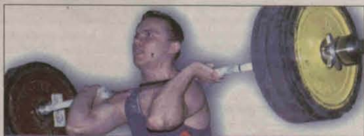
WYNIKI XXVIII TURNIEJU BARBÓRKOWEGO