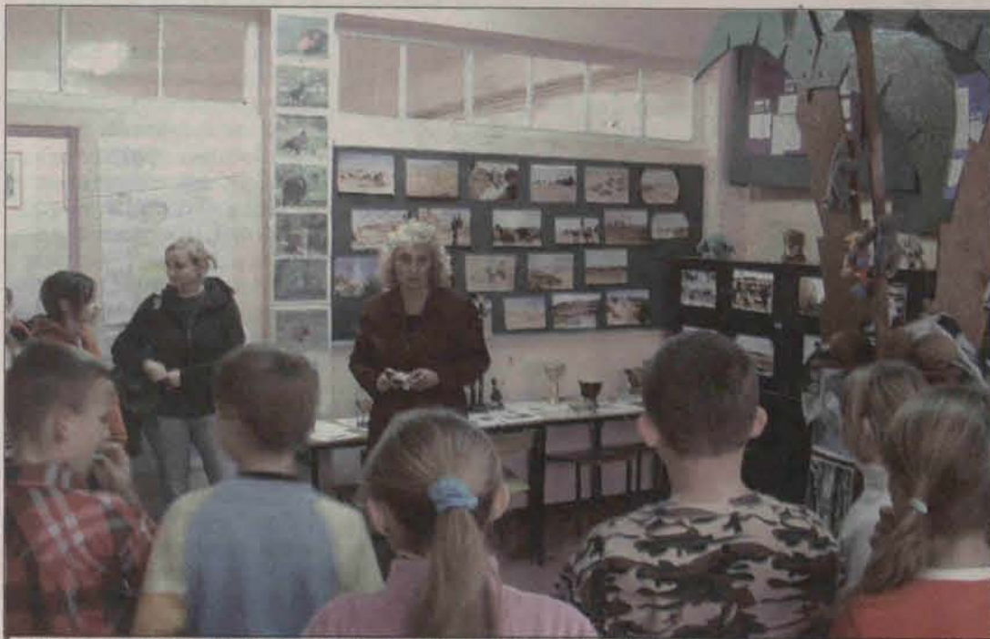
Wystawa o Afryce wzbudza w uczniach nie mniejsze zainteresowanie niż prezentowany zaraz potem film o misji.

Gimnazjum nr 2 w Polkowicach po raz drugi startuje w ogólnopolskim konkursie misyjnym pn. "Mój szkolny kolega z misji".