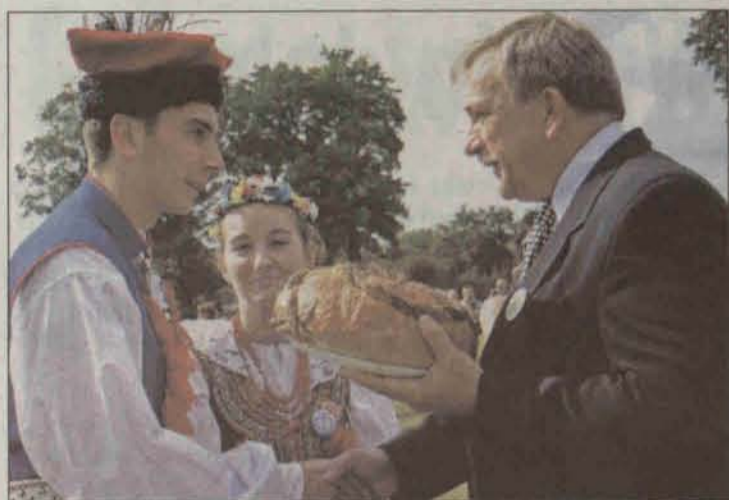
Starosta polkowicki przyjmuje bochen chleba od rolników