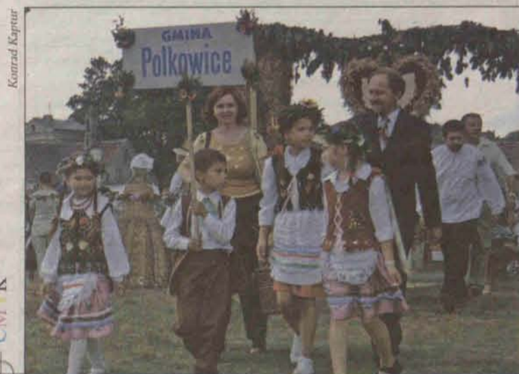
Reprezentacja Polkowic prezentowała się wyjątkowo efektownie