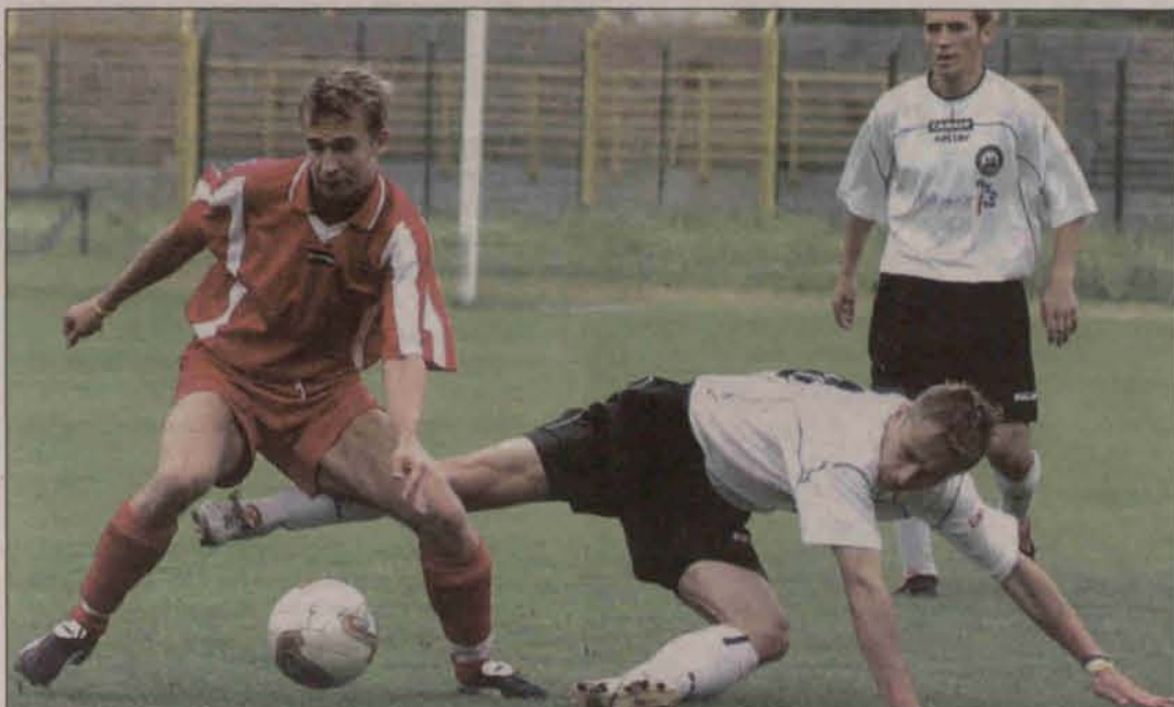
Przed wyjazdem do Wisły Górnik nie dał rady Miedzi Legnica