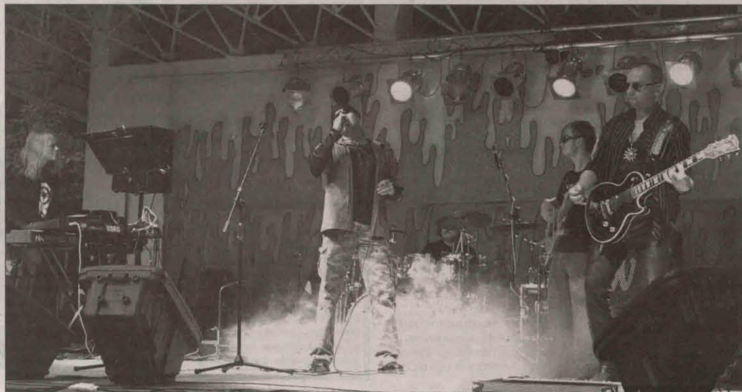
Grupa Badoo dała w Polkowicach bardzo dobry koncert

Tym razem jednak może być inaczej. Koncert Badoo w Polkowicach potwierdził potencjał Gasza. Rozpoczął się co prawda dość niemrawo - od kilku ciekawych popowych kawałków, ale w miarę upływu czasu było coraz lepiej. Publiczność bawiła się razem z wokalistą, choć uczciwie należy przyznać, że jej reakcje były dość powściągliwe. Być może wynikało to po części z tego, że koncert rozpoczął się o godzinie 20, kiedy słońce ledwie chyliło się ku zachodowi.