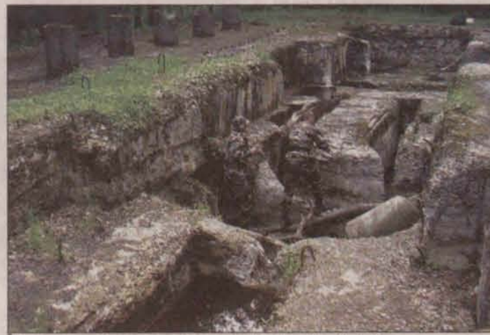
Eksploratorzy z Huntera przeszukują pozostałości kompleksu Osówka

W czasie drugiej wojny światowej do fabryki w Krzacynie, gdzie znajdował się kompleks przyjeżdżały nocą specjalne pociągi, które były w po-