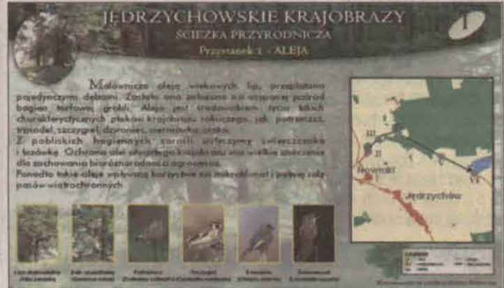
Tablica "startowa" ścieżki edukacyjnej Jędrzychowskie Krajobrazy

Już dwa lata temu Wydział Planowania Przestrzennego i Środowiska opracował projekty tras rowerowych, tras turystycznych i ścieżek edukacyjnych. Prace te wynikają zarówno z Ustawy o samorządzie gminnym, gdzie potraktowane są jako zadania własne gminy, jak również z Ustawy Prawo Ochrony Środowiska. W pierwszym przypadku zadania własne gminy m.in. w zakresie ochrony środowiska i przyrody zostały ujęte w Strategii Rozwoju Zrównowa-