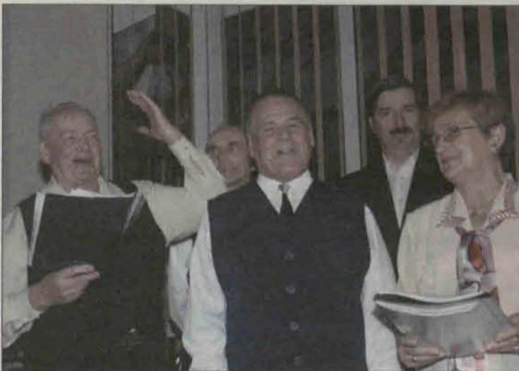
W części artystycznej wystąpiły Srebrne Nutki

Na co dzień niosą pomoc tym, o których zapomnieli wszyscy inni. Nikomu nie odmawiają, mają serca przepięknie dobrocią. Bez nich świat byłby dużo gorszy. 22 listopada obchodzili swoje święto. Były kwiaty, lampka szampa i życzenia wytrwałości w codziennej pracy.