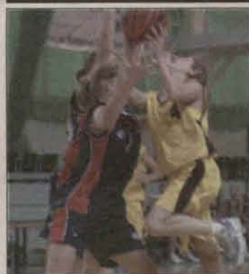
"Trójka" na strefie

Reprezentacja Szkoły Podstawowej nr 3 w Polkowicach wygrała Final Powiatowy w Mini Koszykówce Dziewcząt. 5 stycznia w Polkowicach odbędzie się Półfinal Strefowy.