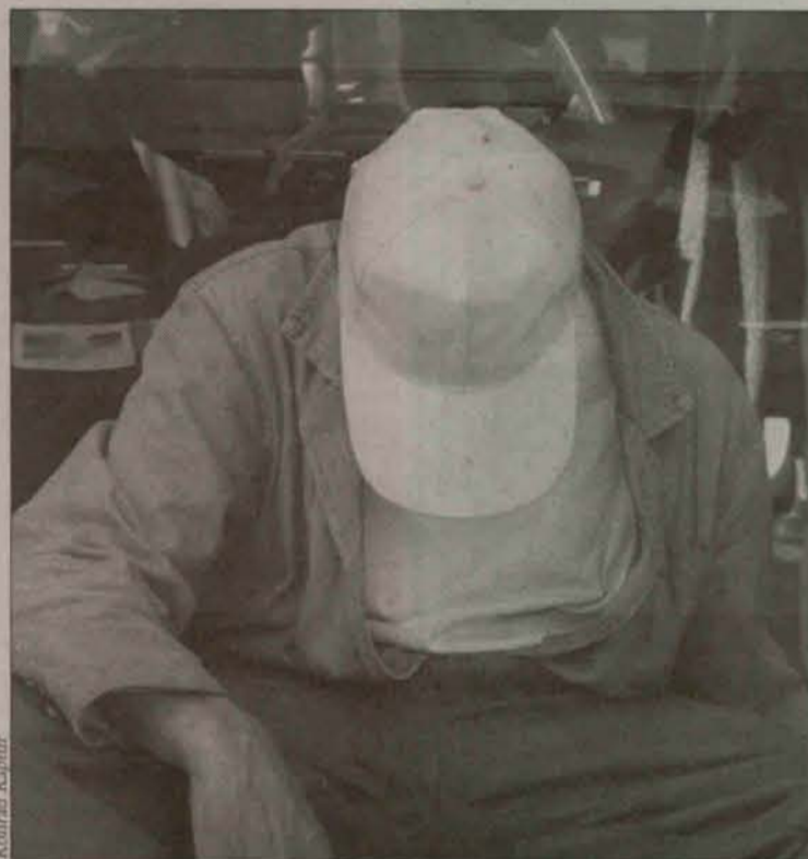
Narkomania to plaga współczesności

Narkomania jest jedną z plag współczesnej Polski. Jej macki dotykają coraz szerszych kręgów ludzi. Współczesny narkoman coraz częściej ma mniej niż 15 lat i to jest zaskakujące. Szkoła jest miejscem, w którym dzieci narażone są na kontakt z narkotykami, dlatego konieczne jest kształtowanie w nauczycielach postaw, które pozwolą na szybkie wykrywanie obecności narkotyków w szkole oraz przeciwdziałanie rozpowszechnianiu się zjawiska narkomanii. Temu celowi służyły spotkania policjantów z nauczycielami Zespołu Szkół w Przemkowie, podczas których funkcjonariusze uczyli jak rozpoznawać oznaki odurzenia narkotykowego. Zaprezentowano również atrapy środków odurzających oraz leków, co do których istnieje podejrzenie, że mogą pojawiać