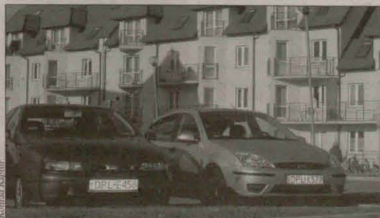
Zimą zadbajmy o nasze auta

Kierowcy nowych samochodów ograniczają się do podstawowych czynności. - Wymieniłem opony i byłem na przeglądzie - tłumaczy jeden z kierowców. - Płyn mam uniwersalne.