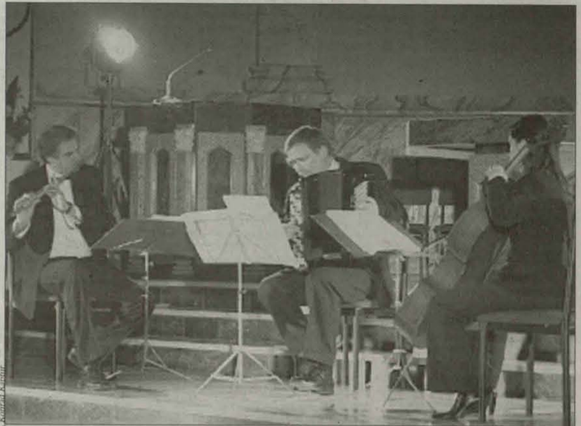
Świętokrzyskie Trio Akordeonowe

Przed 85 laty Polska powróciła na mapy Europy. Dokładnie 11 listopada Rada Regencyjna przekazała władzę wojskową marszałkowi Józefowi Piłsudskiemu, a wojsko zajęło w Warszawie gmachy odwachu na palcu Saskim oraz Pałac Namiestnikowski, gdzie dotychczas mieściło się gubernatorstwo niemieckie. Na budynkach wywieszono polskie flagi, a usunięto z nich niemieckie napisy. Na przestrzeni lat sposób świętowania rocznicy odzyskania niepodległości ewoluował. W dwudziestoleciu międzywojennym święto to obchodzono z należytą mu estymą, inaczej było po zakończeniu działań wojennych, kiedy władzę w Polsce przejęli komuniści. Wówczas uroczystości obchodzono rocznicę wybuchu rewolucji październikowej, odznaczając od czci datę 11 listopada. Od 1989 roku znów świętujemy datę 11 listopada. Dziś jednak święto to obchodzimy trochę inaczej niż przed sześćdziesięcioma laty. Nie potrafimy cieszyć się tak bardzo, świętowaniu towarzyszy raczej nastroj zadumy. Może wynika to z faktu, że wielu z nas czuje się w nowej Polsce obco?