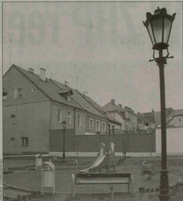
Jeden z bloków należących do zasobów PTBS.

PTBS zawrze umowę o partycypację, z osobą lub firmą zainteresowaną pozyskaniem mieszkania, która określa wstępna kwotę partycypacji i daje osobie partycypującej w budowie mieszkania gwarancję, że ze wskazaną przez nią osobą zostanie podpisana umowa najmu. Szacunkowy koszt partycypacji wynosi dla mieszkania jednopokojowego o pow. 32,20m 2 - 22 200,00zł, dla mieszkania dwupokojowego o pow. 53 m 2 - 36 500,00zł, dla mieszkania