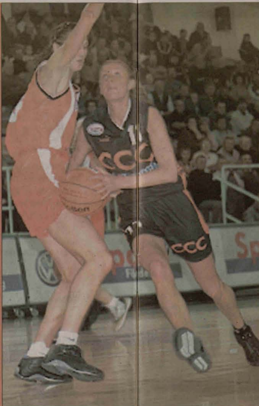
czym zdobywanie medala wydaje się być realne, bowiem po pięciu kolejnych w nowym sezonie polkowiczanki zajmują drugie miejsce w tabeli i do prowadzącego zespołu z Gdyni trzeba zaledwie dwa punkty.