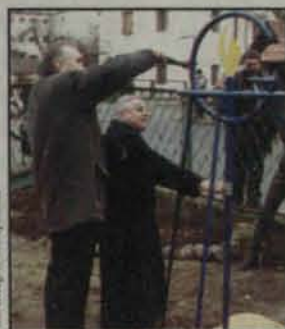
Uroczyste uruchomienie gazociągu

W Przemkowie wszyscy zainteresowani mogą używać gazu ziemnego. Dotąd możliwości takie miało ledwie 900 gospodarstw domowych. Po uroczystym otwarciu nowego gazociągu możliwości są, ale nie ma zbyt wielu chętnych.