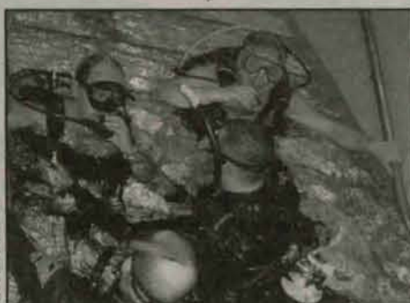
Przed zejściem w „głębinę”

Butla z tlenem, okulary, pletwy i odrobina odwagi wystarczyła, aby zobaczyć piękno podwodnego świata.