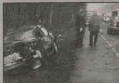
W tym wypadku nie było ofiar

W poniedziałek na trasie Polkowice – Lubin doszło do kolizji drogowej: samochód osobowy wjechał w tył auta ciężarowego, wiozącego dwie butle z gazem.