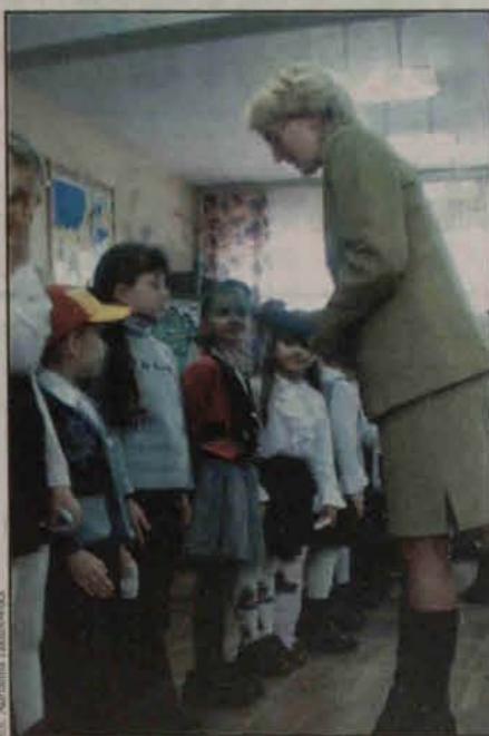
Pasowanie na „pierwszaka”

Tegoroczni pierwszoklasiści z Zespołu Szkolno – Przedszkolnego w Radwanicach zostali pełnoprawnymi uczniami szkoły.