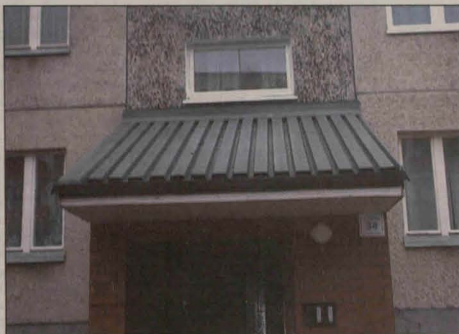
I miejsce – ul. 11 Luty 34 – wymiana okien na klatce, malowanie klatki nr 35