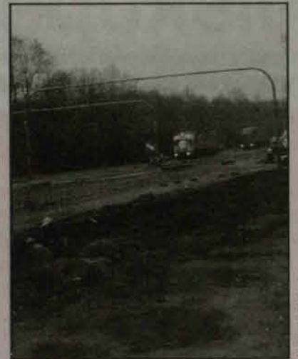
Dot. Moniki Szatkowskiej