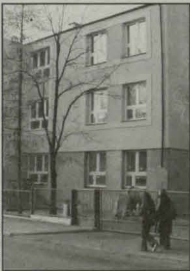
Szkola jest pusta już od ponad roku

Dzieci ze Szkoły Podstawowej w Jerzmanowej już drugi rok muszą korzystać z pomieszczeń budynku gimnazjum. Powodem jest wielomiesięczny remont podstawówki, który przeciąga się w czasie.