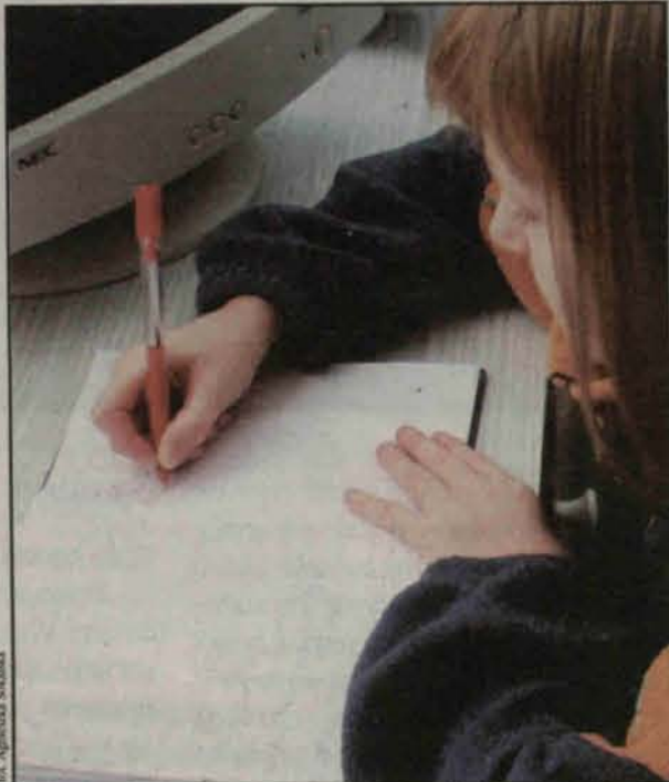
Staram się, a błędów wciąż robię sporo

cin, student fizyki. – Kłopotem były natomiast moje błędy ortograficzne i to, że piszę jak kura pazurem. Rodzice kupowali mi różne książki i zapisywali na kursy, ale nawet dzisiaj potrafię sło-