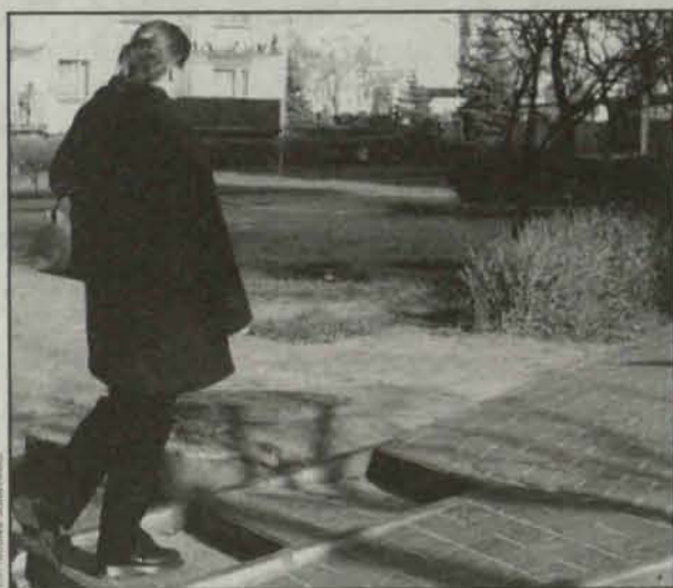
Powstały już ciągi piesze

– We wrześniu między osiedlem Hubala a Dą-