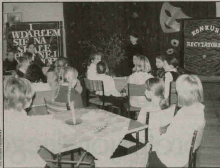
Widzowie słuchali w skupieniu

Laureaci dwóch pierwszych miejsc z każdej kategorii zaprezentują się w Polkowicach.