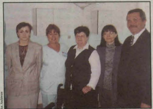
Przekazanie sprzętu rehabilitacyjnego dla Pogotowia Ratunkowego w Polkowicach

– Możliwość otrzymania bezpłatnie balkonika stała się dla mnie