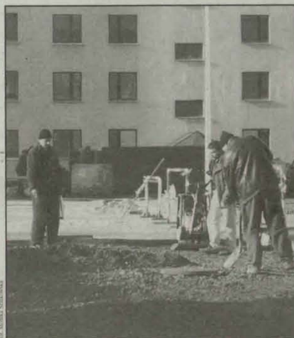
Prace ciągle są prowadzone

Przed rozpoczęciem prac na osiedlu projekt zagospodarowania kon-