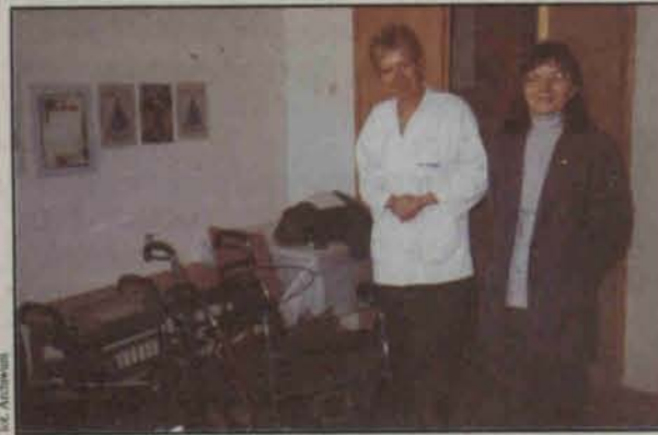
Wózki dla pacjentów Ośrodka Opieki Paliatywnej

Z każdą chorobą trzeba walczyć. Nie podlega to dyskusji. Dyskutujemy o cenach leków, sprzętu potrzebnego chorym – one pochłaniają w naszym odczuciu ogromne środki finansowe, ale czy powinny?