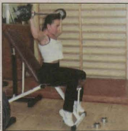
Sport to zdrowie