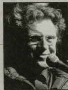
Zbigniew Wodecki w Polkowicach