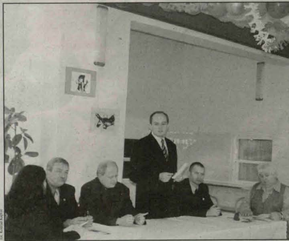
Spotkanie zgromadziło wielu lokalnych urzędników

nych ze współpracą między związkiem a władzami powiatu i gminy. Rozmawiano, między innymi o budowie Domu Spokojnej Starości, szansach i zagrożeniach