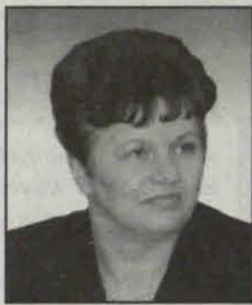
Stanisława Bocian, burmistrz Polkowic od grudnia 2001