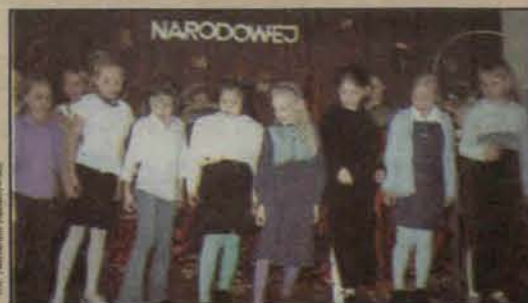
Obchody Dnia Edukacji Narodowej

W Polsce Dzień Edukacji Narodowej obchodzony jest bardzo uroczysto zarówno przez uczniów, jak i nauczycieli. Są kwiaty, życzenia i nie tylko.