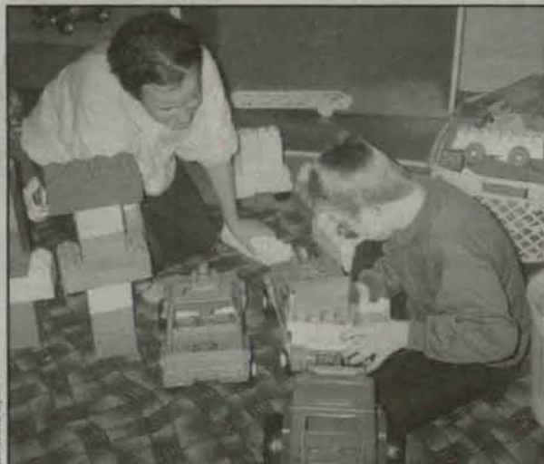
Wspólna zabawa wolontariuszek z dziećmi

Parafialne Koło Caritasu w Gaworzycach działa od trzech lat. Ostatnio do jego dzieła pomocy potrzebującym przyłączyli się młodzi wolontariusze z Gimnazjum Publicznego.