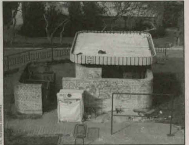
Widok z okna wprost na śmietnik

„Cuprum” w Polkowicach. – Niestety nie można przenieść w inne miejsce wybudowa-