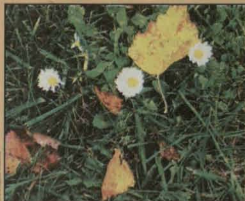
Mimo jesieni, stokrotki wciąż kwitną

Jak twierdzą starzy leśnicy każda pora roku ma swój zapach. Latem czuć np. aro-