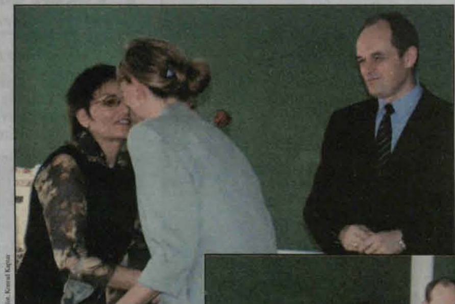
Ukoronowanie całorocznej pracy