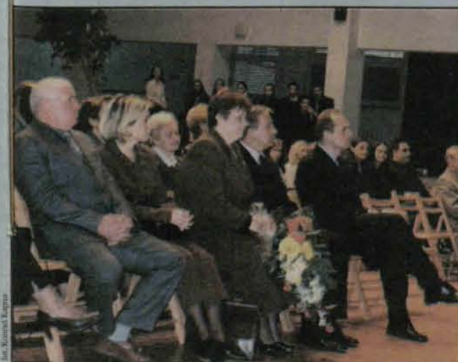
Uroczystość zgromadziła wielu lokalnych notabli

– W drodze do jednoczącej się Europy czeka nas spędzania jeszcze wspanialszych jubileuszy. Były kwiaty, uściski, wzajemne pochwały, pełne ciepła życzenia i występy uczniów. – Nie powinniśmy odejść z tej ziemi nie pozostawiając śladów, które polecać będą naszą pamięć potomności – ten cytat z Napoleona najlepiej chyba oddaje motywację leżącą u podstaw aktywności wszystkich tych, dzięki którym szkoła przeżyła trzydzieści lat. Pokolenie, które dziś nią zarządza, wspólnie z władzami samorządowymi, dzięki którym możliwe było powstanie tak okazałych budynków, jak chociażby Aula Forum, co do jednego może być spokojne, śladów polecających ich pamięć potomności zostawiło aż nader sporo.