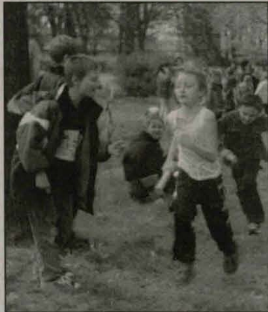
Bieg rozgrzewa, gdy na dworze zimno.

W Szkole Podstawowej im. Kornela Makuszyńskiego w Gaworzycach zorganizowano Bieg o Bochenek Chleba. Ideą biegu była nauka szacunku dla „chleba powszedniego”, którego nie ceni się, gdy ma się go pod dostatkiem, a docenia najczęściej dopiero wtedy, gdy zaczyna go brakować.