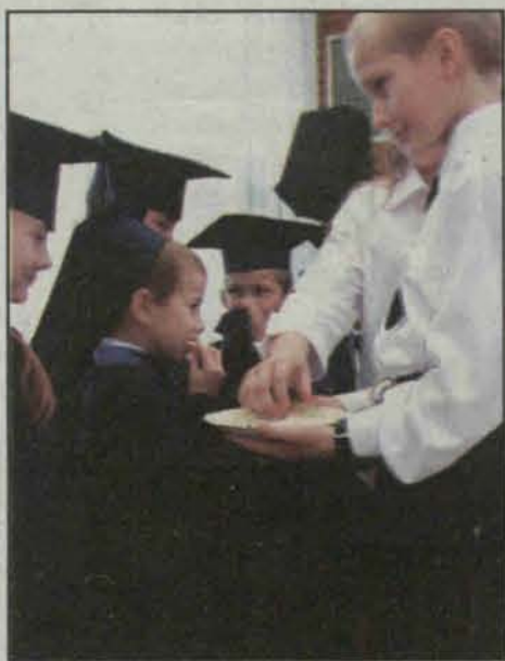
Pierwszy egzamin zaliczony