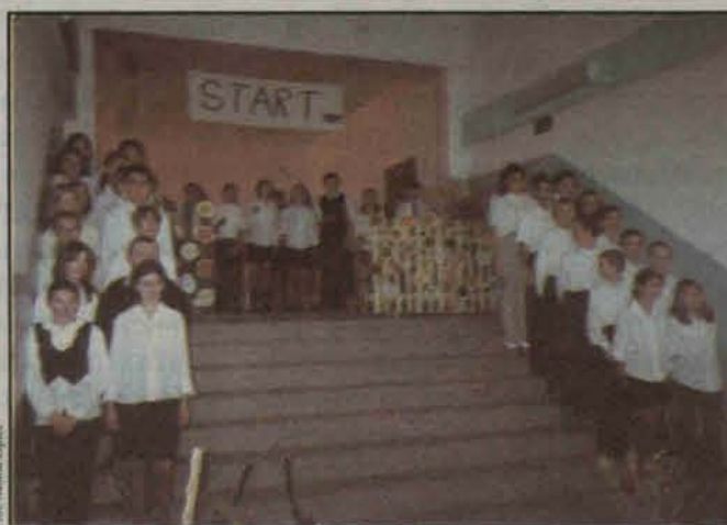
Dla tych uczniów to był uroczysty dzień

- Wielkie mi uczyniła pustki w życiu moim, moja droga polonistko, jednym postępkim