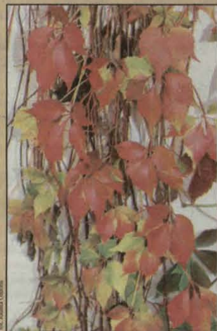
Jesień zachwycia swoimi barwami