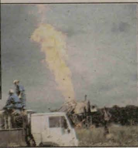
Płomień momentami sięgał 60 metrów wysokości