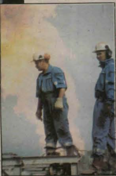
Praca trwa bez żadnych przerw