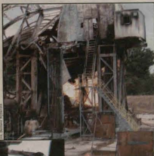
Ruiny zwalonej wieży