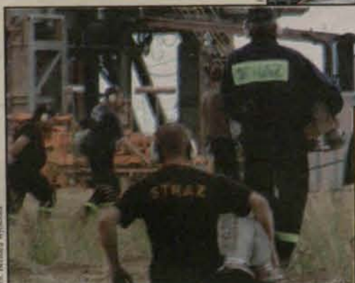
Działaniom strażaków towarzyszył ciągły pośpiech