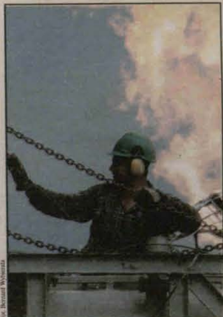
Na miejscu panował tak duży hałas, że ratownicy porzucali się na mię