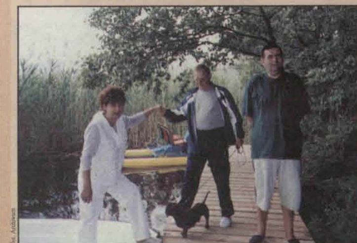
Przez z rodziną