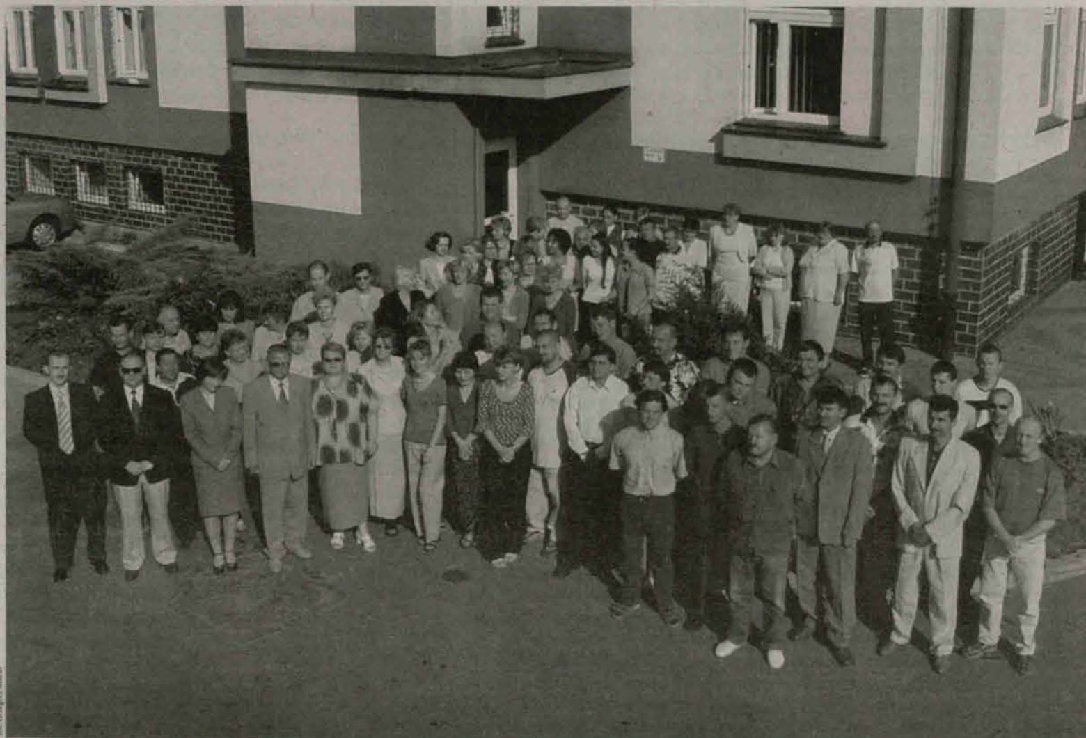
Zaloga Przedsiębiorstwa Gospodarki Miejskiej w Polkowicach