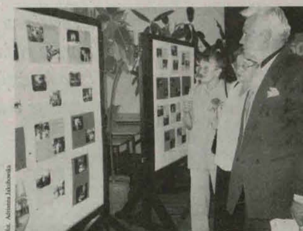
Absolwenci Szkoły Podstawowej w Radwanicach spotkali się po 50. latach

Spotkanie było świetną okazją do wspomnień.