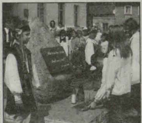
160 rocznica urodzin patronki

Po zakończonym przedstawieniu dzieci wypuściły w niebo balony z listem do wszystkich dzieci. Może ktoś odpowie?