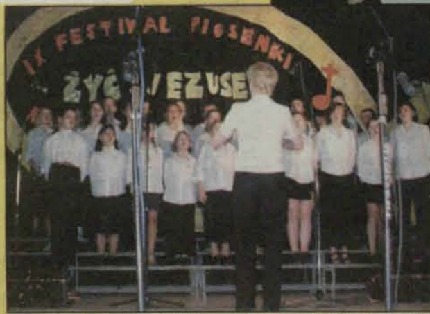
Konkurencja była duża. Jury oceniało około 650 dzieci z ponad 30 zespołów