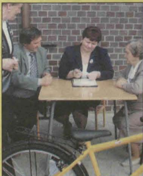
Komisja skrupulatnie zapisywała numery szczęśliwców