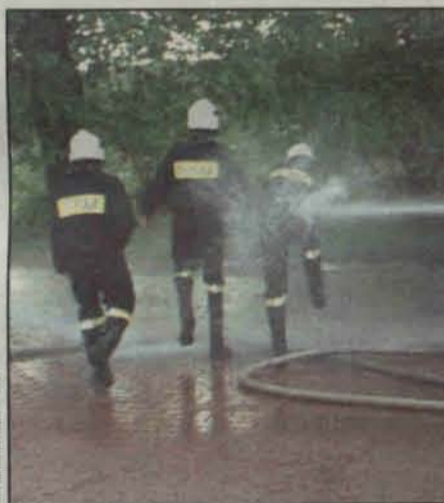
Prawdziwie bojowy chrzest młodych strażaków

Czwartego maja każdego roku w całej Polsce strażacy obchodzą swoje święto. Tego dnia strażacy z Ochotniczej Straży Pożarnej w Jerzmanowej uczestniczyli w uroczystym poświęceniu figury świętego Floriana – patrona strażaków.