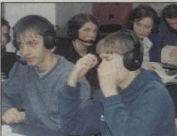
Zajęcia z języków obcych w Gimnazjum w Radwanicach

Nauka odbywać się będzie w kilkusobowych grupach, co umożliwi lepsze przyswajanie wiedzy. – Młodzieży rozpoczynającej naukę w tutejszym liceum zapewniamy do-