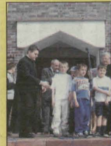
W zawodach sportowych wzięło udział 31 drużyn