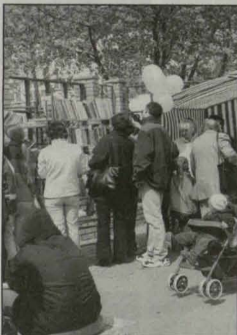
Zainteresowanie książkami było duże

Jest wiele osób, dla których książka nigdy nie „przegra” z telewizją, a często nie stać nas na jej zakup.