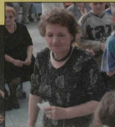
Jedna z osób, której los okazał się szczęśliwy