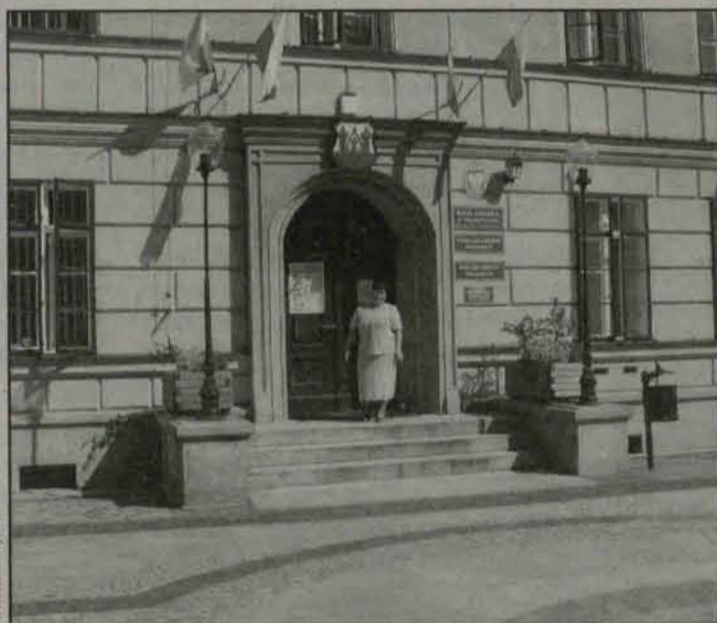
Dzięki wprowadzonemu systemowi ISO Urząd Gminy stał się bardziej otwarty dla klientów *

Opracowano też karty usług, przeznaczone dla klientów zewnętrznym,