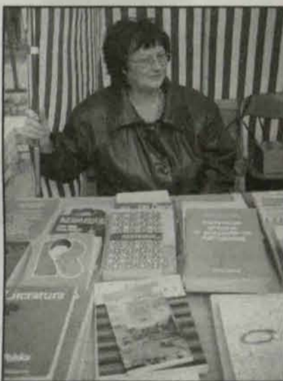
Sprzedano ponad 400 książek.

Miejsko - Gminna Biblioteka Publiczna wyszła naprzeciw miłośnikom książek i 27 kwietnia zorganizowała kiermasz taniej książki. Kiermasz odbył się z okazji przypadającego w kwietniu Światowego Dnia Książki i Praw