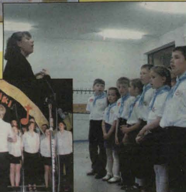
Ostatnia próba przed wejściem na scenę