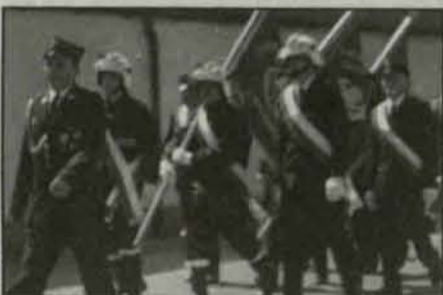
Strażacy przeszli ulicami Radwanic

Maj to piękny miesiąc nie tylko ze względu na porę roku. W tym miesiącu przypada najwięcej świąt i wolnych dni. Świętują również strażacy obchodząc Dzień św. Floriana.