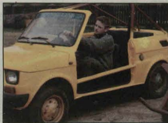
Pocziwy „maluch” przerobiony na wóz terenowy

niu, wehikuly wciągane są do góry samochodem. – Postanowiłem wybudować tor do jazdy terenowej gdyż, nie miałem pracy w moim warsztacie samocho-