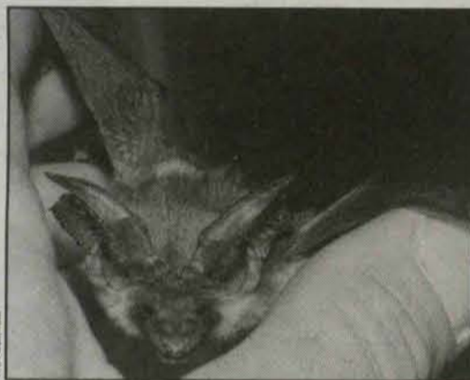
Nietoperze to towarzyskie zwierzęta

Ponieważ nietoperze są zagrożone wyginięciem, bardzo potrzebna jest im przyjaźń człowieka.