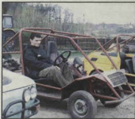
W miejsce spawano stalowe rury

Pocziwe „maluchy” przerobione na wozy terenowe od 1 maja kuszą każdego chętnego do spróbowania swych sił w jeździe terenowej. Na nowo otwartym torze crossowym w Przemkowie, przy ul. Strzeleckiej, nie jest potrzebne prawo jazdy, a jedynie dowód osobisty lub... zgoda rodziców, no i kilka złotych.