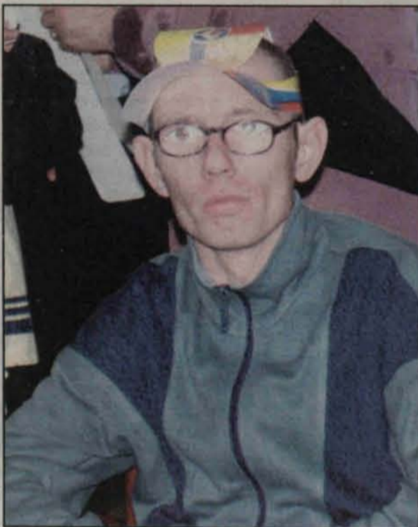
Chcą godnie reprezentować Polkowice