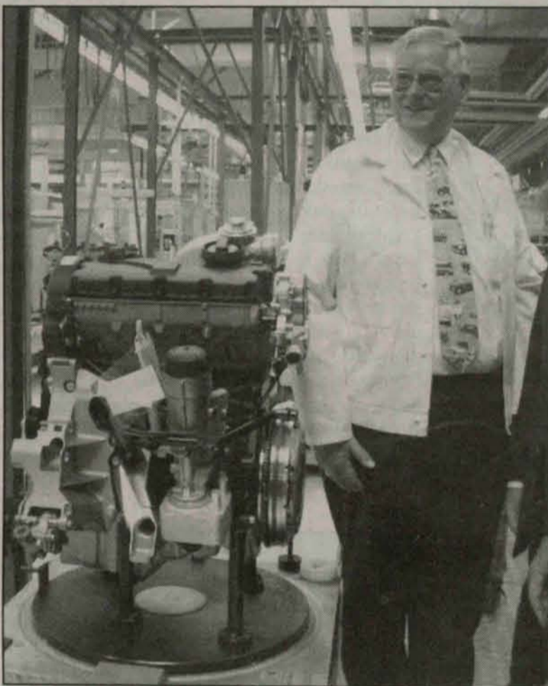
Milionowy silnik opuścił linię produkcyjną w polkowickiej fabryce Volkswagena

Swoją obecnością jubileuszową produkcję zaszczylił również Jacek Piechota, Minister Gospodarki. – Jestem pod urokiem tego miejsca – mówił. – Ta fabryka jest dowodem na to, że w Polsce możemy stworzyć dogodny