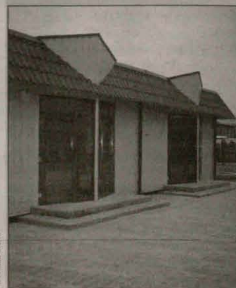
Pawilonów zamkniętych jest 20

Więcej o nowym tar-gowisku w kolejnym numerze.