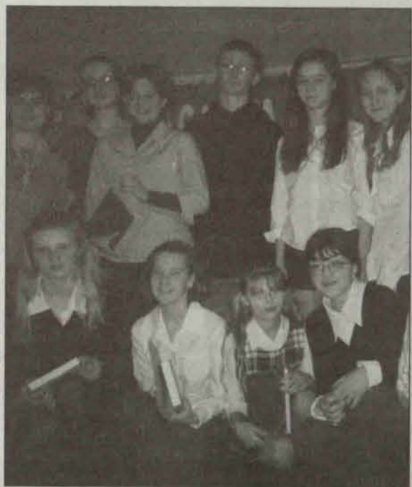
Laureaci konkursu z opiekunami