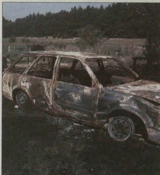
Efekt zwarcia instalacji elektrycznej w samochodzie