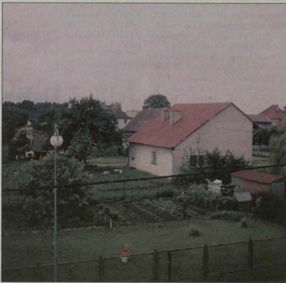
Ośiedle domków jednorodzinnych w Grębocicach

ny takiego domu, ponieważ na jego wyceńnię składa się wiele czynników, niejednokrotnie zależnych od wielu działań.