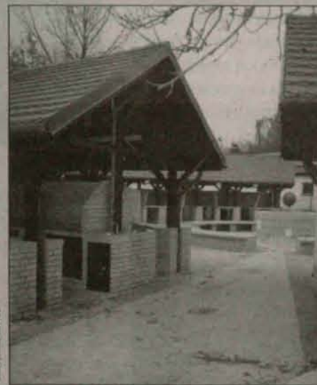
Pierwszeństwo na nowym targowisku mają mieszkańcy Polkowic

Pawilony mają 12 m kwad. p o w . u z y t k o w e j .