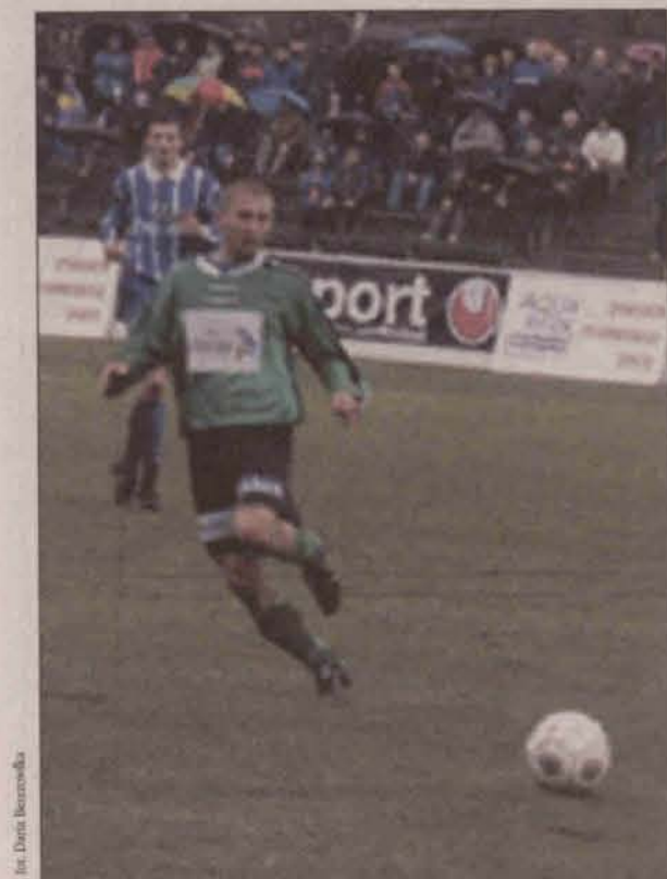
Gdzie podziła się dawna forma?