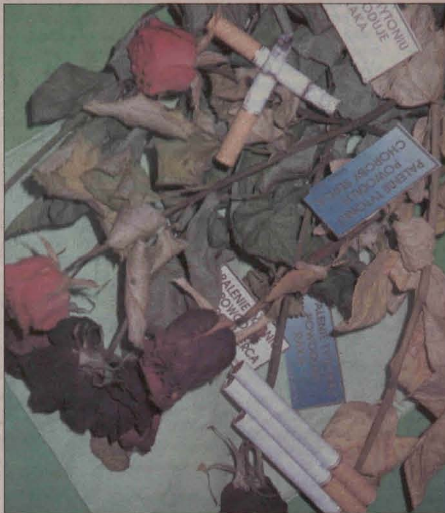
Twoje zdrowie jest ważniejsze

Jeżeli pali tylko jedna osoba w rodzinie, to za pieniądze zaoszczędzone na papierosach można kupić: