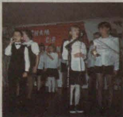
„Tylko w polu biały krzyż...”

Podobał się też występ zespołu „Gaworzanki” oraz gościnnie występujących „Pęcławianek” z Pęcławia.