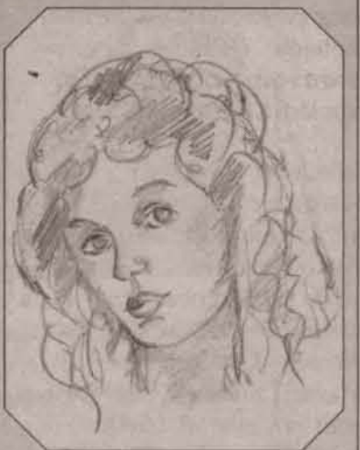
Rys. Jolanta Ozdoba

Czosnek zabija bakterie i działa dezynfekująco. Jeśli będziesz regularnie smarować sokiem z czosnku wypryski skórne, znikną one niebawem bez śladu.