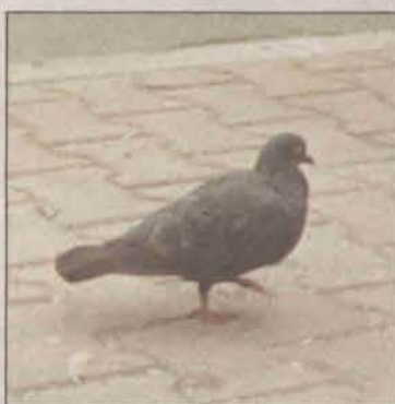
Gołębie mogą być przyczyną choroby