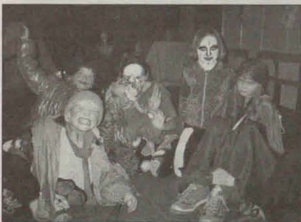
Przed wyruszeniem na straszenie

W sobotę mieszkańcy Gaworzyc zostali „zaatakowani” przez wszelakiej maści straszdyła.