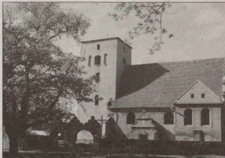
Kościół pw. Podwyższenia Krzyża Świętego w Szymocinie