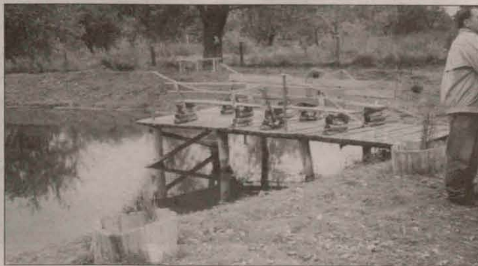
Pomost w Sieroszowicach przed remontem