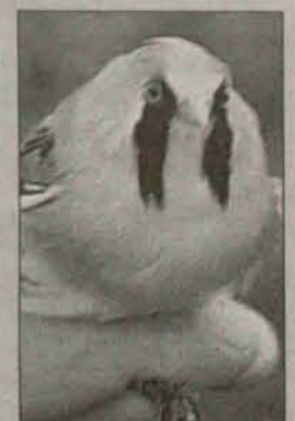
Obrazekowanie Sikorki wąsatki w Przemkowskim Parku Krajobrazowym.