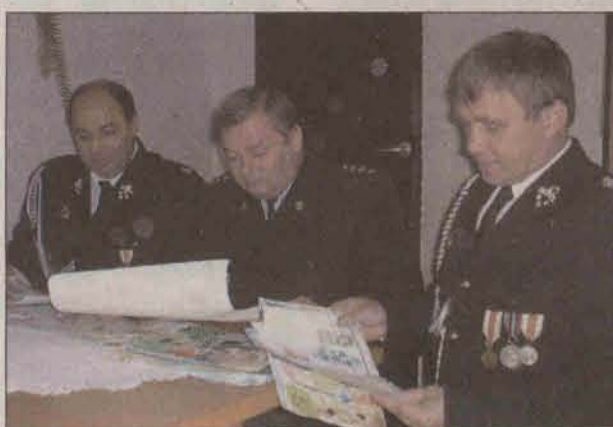
Prac było 168, a więc było w czym wybierać