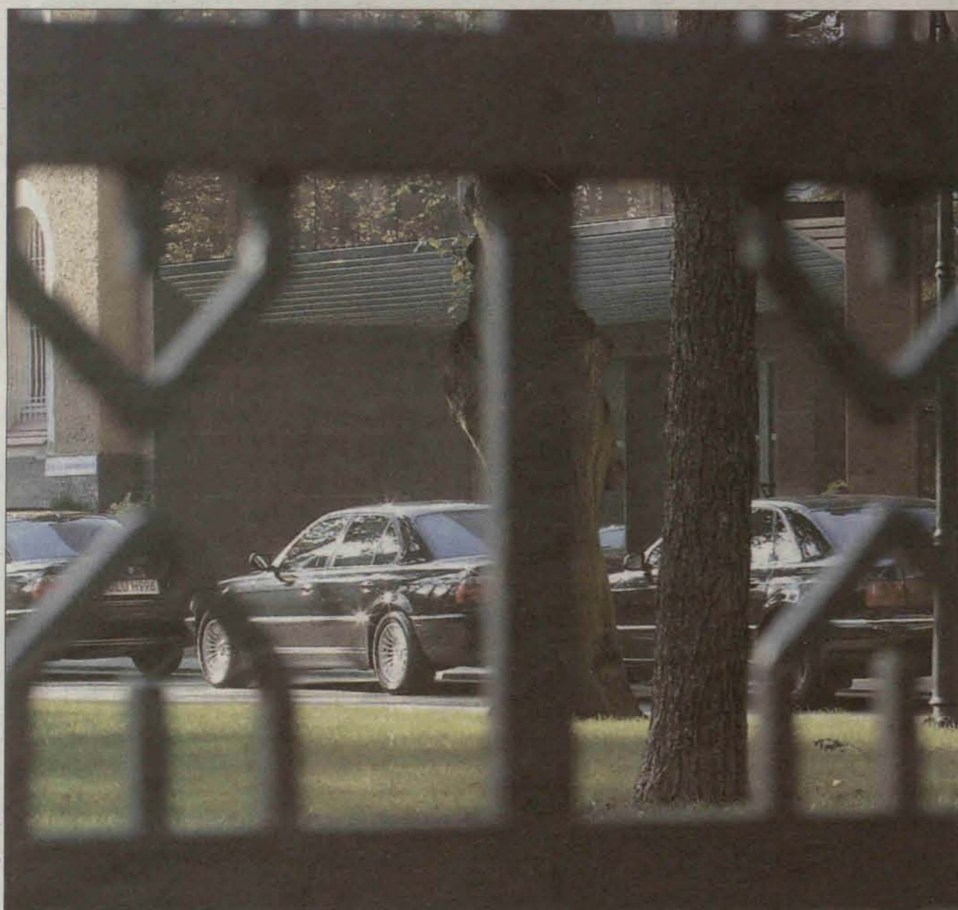
Dowód zamożności spółki: sznur ekskluzywnych samochodów przed Biurem Zarządu. Pierwsza oznaka tego, że prezesi są w pracy.

Poniżej przedrukujemy obszernie fragmenty tekstu ze „Słowa Polskiego“ (31.10 – 1.11.2001) pt. „Miedziowe fortuny do wzięcia“ pióra red. Mirosławy Bożyńskiej.