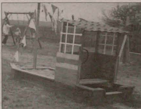
Piaskownica, ale jaka ciekawa

– Mieszkańcy sami zagospodarowali ten plac, ale brakuje im jeszcze świetlicy – opowiada sołtys. – Gdyby była taka możliwość, to zamiast nagrody pieniężnej, woleliby mały domek kwaterowy po powodziach – kończy Stanisław Pasternak.