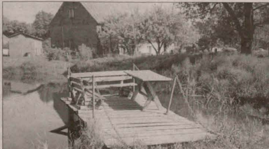
Pomost po remoncie