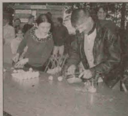
Było co oglądać

Mieszkańcy Nowej Kuźni (gmina Radwanice) po dziesięciu latach doczekali się nowej asfaltowej nawierzchni na drodze biegnącej przez całą wieś. W dalszych planach jest wykonanie nawierzchni na drodze łączącej Nową Kuźnię z Jabłonowem (gmina Chocianów).