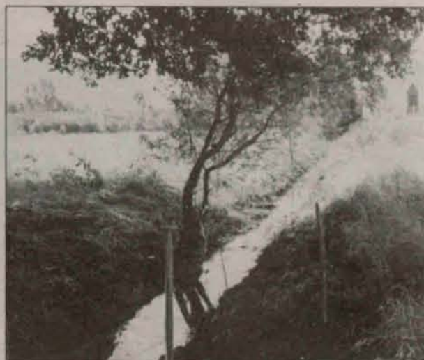
Tak wygląda rów oczyszczony przez mieszkańców