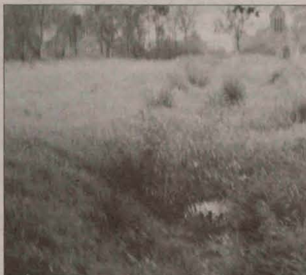
Zarośnięty rów w Radwanicach

Już po raz drugi rozstrzygnięto konkurs dla mieszkańców wsi.