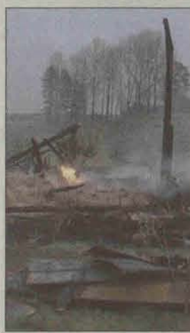
Tylko tyle pozostało po stodole w Trzebczu

Prawie trzy godziny trwało ugaszenie pożaru, który wybuchł w Trzebczu. Około godz. 23.30 powiadomiono straż pożarną, że płonie stodoła. W akcji brały udział cztery zastępy straży pożarnej. W pożarze spłonęły: wózek konny, sieczkarnia, i około 4 ton siana.