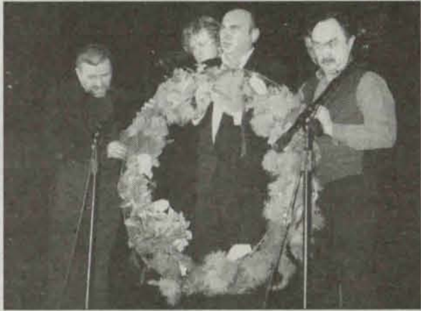
Aktorzy Teatru Polskiego ze Szczecina

Rozpoczęło się od przysięgi: „...Brzydkich słów, które w dzisiejszym programie usłyszycie nigdy, nikomu nie powtórzę. Tak mi dopomóż Czarny Kocie Rudy“.