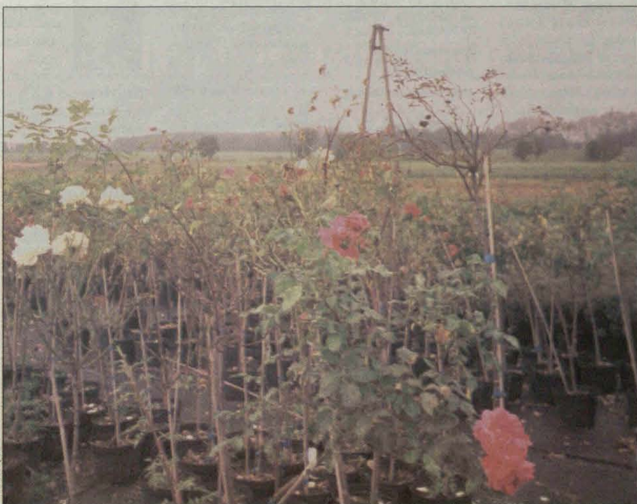
Oczkowane róże przygotowane do sprzedaży