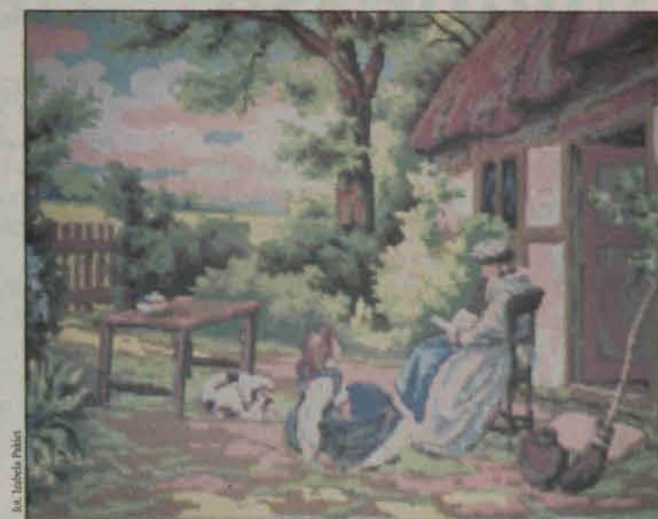
Jedno z dzieł Krystyny Kolman

- Gotowe wzory i nici są drogie i nie każdego na nie stać - wyjaśnia