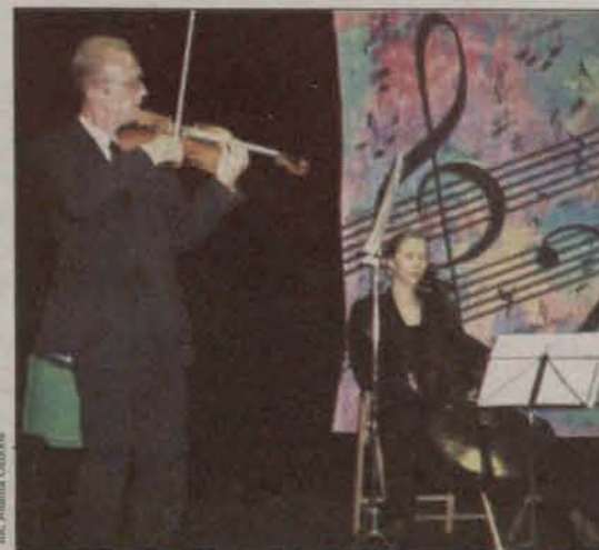
Nowy sposób na poznanie muzyki