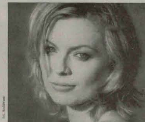
Anna Maria Jopek