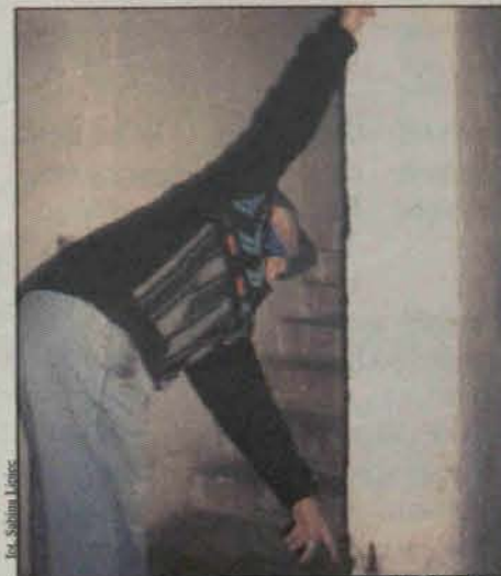
Tu były drzwi

Coraz mniej zaskakujące są informacje o włamaniach i kradzieżach. Coraz częściej martwimy się o to, że nas też to może spotkać. Czasami większe straty od samej kradzieży powoduje wandalizm sprawców.