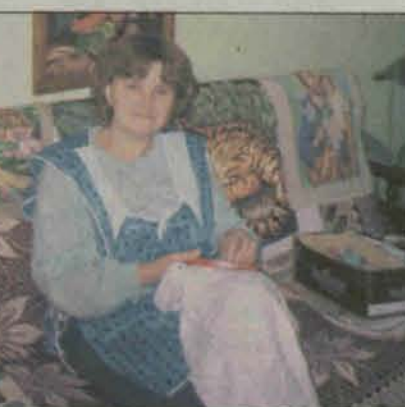
Artystka podczas wyszywania obrazu

ka, poduszeczki, koszulki, kaftaniki. Wkładałam w nie bardzo dużo pracy i serca. Często wyszywałam nocami. Każdą pracę chciałam skończyć jak najszybciej - dodaje wzruszona.