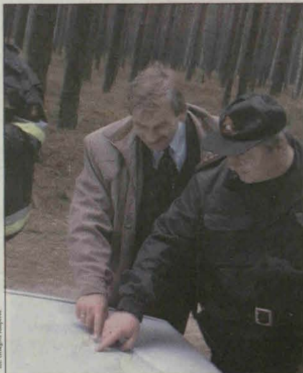
Utworzono sztab kryzysowy

Na szczęście jest to tylko scenariusz przeprowadzonych ćwiczeń dla jednostek ratowniczo - gaśniczych. - Nasza praca to oprócz działań, do