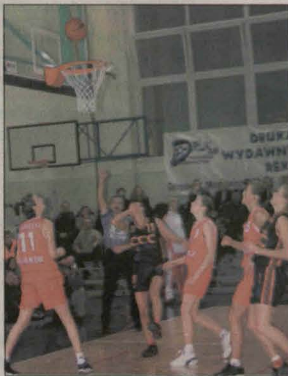
Polkowiczanki wygrały w inauguracji ekstraklasy