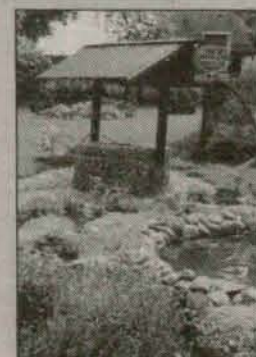
Ogród Jadwigi i Małgorzaty Turczyn z Komornik - I miejsce w V edycji konkursu „Ogród Roku“