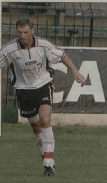
Tuż przed gwizdkiem kończącym spotkanie