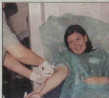
Do odważnych świat należy

Każda kropla krwi jest bezcenna. Nie znamy chwili, kiedy i nam będzie ona potrzebna, powinniśmy się z tym liczyć. Musimy zdawać sobie sprawę, że oddanie choćby odrobiny krwi może uratować czyjeś życie.