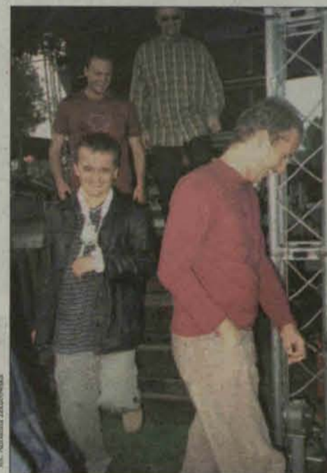
Członkowie zespołu zadowolony z koncertu