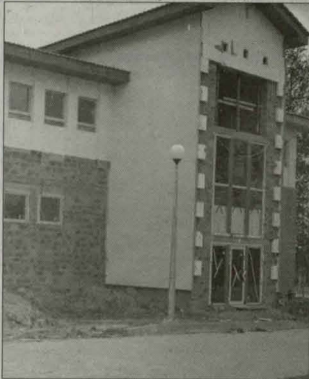
Budynek gimnazjum rozwiąże wiele problemów

Otwarcie pierwszej części kompleksu Centrum Edukacji Wiejskiej w Radwanicach zaplanowano na początek listopada br. Budowę rozpoczęto w ubiegłym roku.