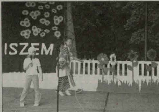
Siostry Pyszówny w piosence o pajacyku

Publiczność gromko oklaskiwała panów w czarnych kapeluszach śpie-