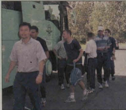
Zawodnicy z zapalem „zapakowali się” do autobusu