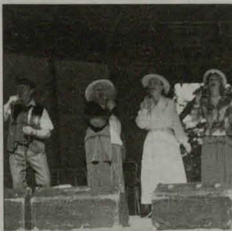
Zespół „Wesoły Lwów” po raz pierwszy wystąpił w Radwanicach

W Głogowie po raz siódmy odbył się Przegląd Kultury Polskiej „Kresy 2001”. Tegoroczny przegląd uświetniły m.in. zespoły folklorystyczne „Stare Jary” i „Harmonia” z Wilna oraz „Wesoły Lwów” z Lwowa.