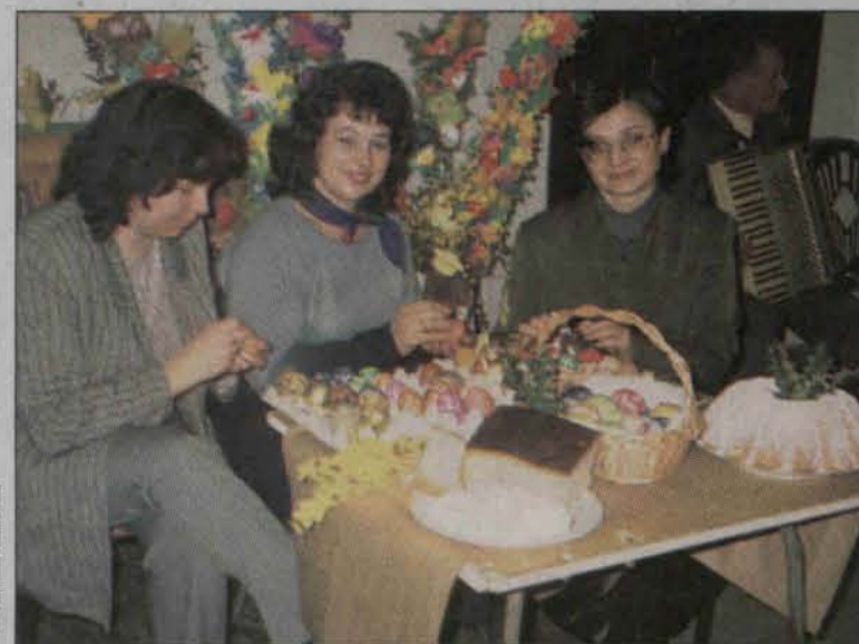
Wspólne przygotowania do świąt