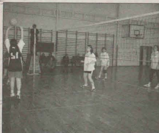
Kolejny mecz siatkówki dostarczył sporo emocji

W turnieju wzięły udział trzy zespoły siatkarek. W rozgrywkach prowadzonych systemem każdy z każdym zwyciężyli gospodarze, czyli drużyna Gminnego Uczniowskiego Klubu Sportowego „Sokół” z Jerzma-