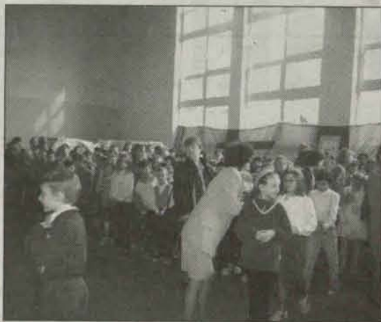
Podczas uroczystości związanych z wyborem patrona

Po prezentacjach odbyło się głosowanie. Uczniowie, a także