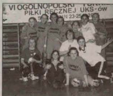
Drużyna z Gaworzycy

Większość kosztów wyjazdu dziewczęta musiały pokryć same, tylko część finansowała Rada Rodziców z Gimnazjum Publicznego w Gaworzycach.