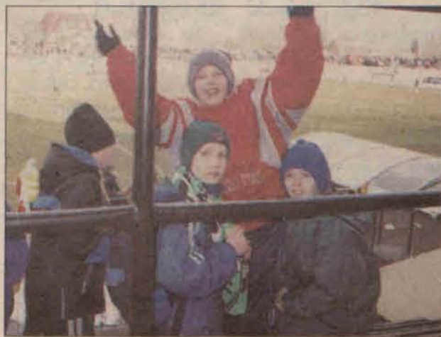
Młodzi kibice również dopingowali piłkarzy