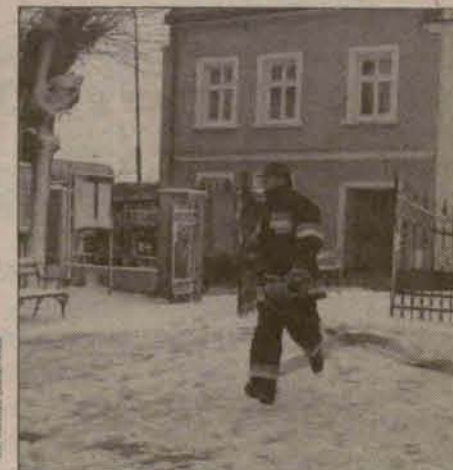
Szybka akcja strażaków

Kolejne ćwiczenia planowane są na terenie Zakładów Górniczych „Sieroszowice“.