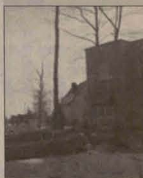
Ostatnie topole w kolejkę do ścięcia