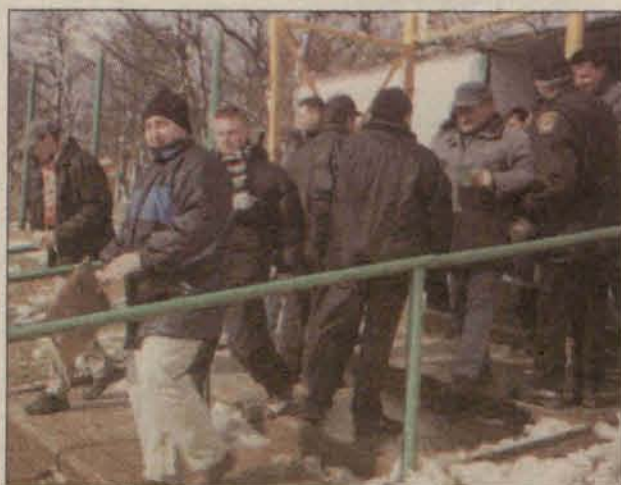
Na ten mecz ścigały tłumy