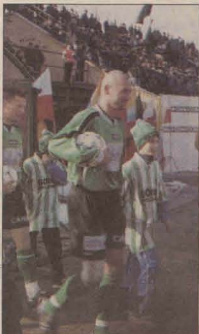
Pilkarze i ich następcy?

Spotkanie zakończyło się bezbramkowym remisem. Z pewnością nie tego spodziewali się kibice obu zespołów. Wydawało się, że „objawienie sezonu”, jak nazywany jest Górnik, nie przestraszy się przeciwnika zza miedzy. Tym bardziej, że w pierwszej jedenastce Zagłębia nie było aż pięciu czołowych zawodników. Polkowiczanie zagraли jednak bardzo defensywnie