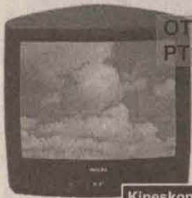
OTV PHILIPS 21 PT1654