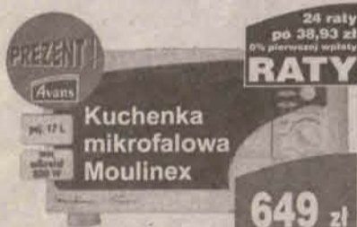
Kuchotka mikrofalowa Moulinex