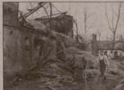
Zmagania z ogniem trwały 10 godzin