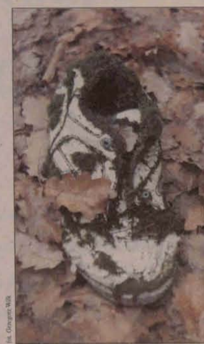
Pierwsze miejsce w kategorii „przyroda”