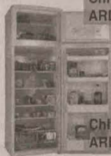
Chłodziarko-zamrażarka ARDO FDP 23