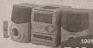
Wieża AIWA NSX-SZ 35