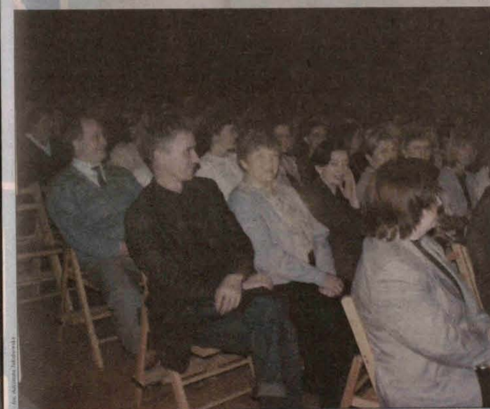
Publiczność słuchała recitalu Bajora w ogromnym skupieniu

Michał Bajor miał dobry kontakt z publicznością i po zakończeniu koncertu chętnie rozdawał autografy i pozwalał do zdjęć.