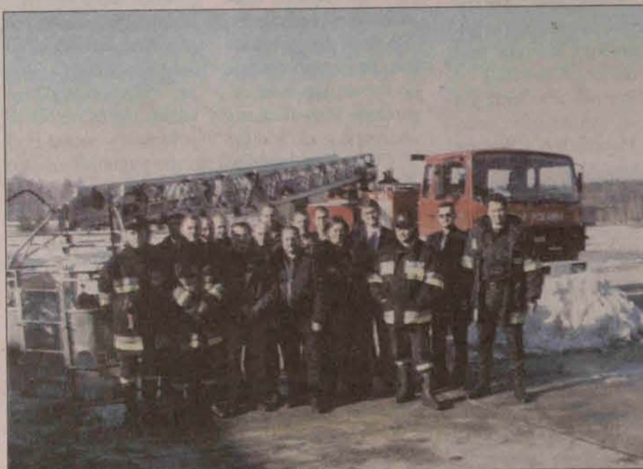
Pozowanie do wspólnego zdjęcia