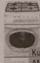
Kuchotka AMICA G5E3.32ZpD