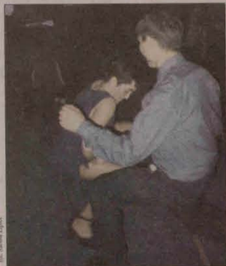
To był twist

Cały dochód ze sprzedaży biletów, czekolady oraz z licytacji prac plastycznych przeznaczono na potrzeby szkoły.