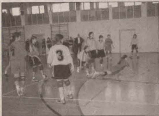
Mecz był zacięty

O tym, kto wygra turniej wiadomo było właściwie już po pierwszym meczu. Zmierzyły się w nim bowiem najlepsze drużyny: Gimnazjum z Gaworzyc i Gimnazjum z Polkowic. Mecze były bardzo zacięte. Chwilami trudno było wręcz rozstrzygnąć, czy niektóre zagrania nie są zwykłymi faulami. Dziewczęta z pozostałych drużyn z obawami