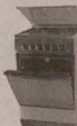
Kuchnia gazowo-elektryczna A 640 EE INOX

wys. x szer. x gł. 142 cm x 54 cm x 58 cm klasa energochłonności A