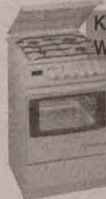
Kuchotka WROZAMET 3477