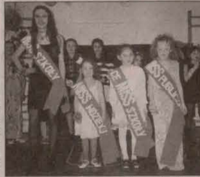
Miss w pełnej krasie