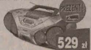
Radiomagnetofon PHILIPS AZ 1570

wys. x szer. x gł. 155 cm x 50 cm x 54 cm