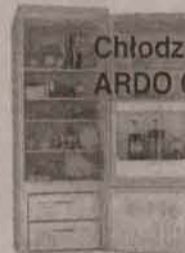
Chłodziarko-zamrażarka ARDO CO 23B