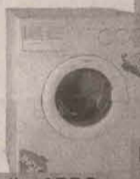
Pralka ARDO A 400 400 obr.