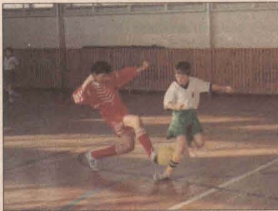
Młodzi piłkarze w akcji