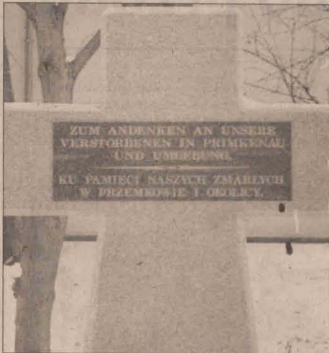
Odsłonięcie krzyża nastąpi w kwietniu

Wizyta Niemców zapowiada się naprawdę ciekawie. Oprócz oficjalnych spotkań, zaplanowano imprezy artystyczne i wystawy. Atrakcyjnie zapowiada się szczególnie wy-