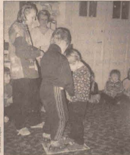
Żeby tylko zmieścić się na kawałku gazety

się im najbardziej. Na ich życzenie stworzono balonową siatkówkę.