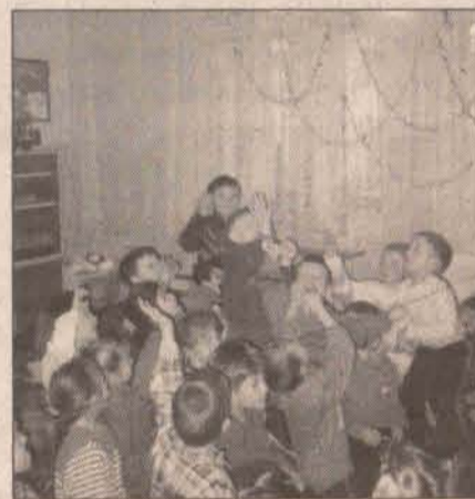
Najbardziej podobała się balonowa siatkówka