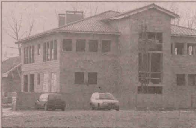
Centrum powstaje w szybkim tempie

Dzięki nowej inwestycji gminy Radwanice oraz starostwa powiatowego zaplanowanej na lata 2000 - 2002 powstanie Centrum Nowoczesnej Edukacji Wiejskiej z siedzibą w Radwanicach. Całe zadanie jest finansowane z różnych