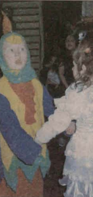
Dzieci świetnie się bawiły

– I rzeczywiście maluchy tańczyły i skakały ile im tylko sił starczyło. Dzieci chętnie uczestniczyły w konkursach i grach organizowanych