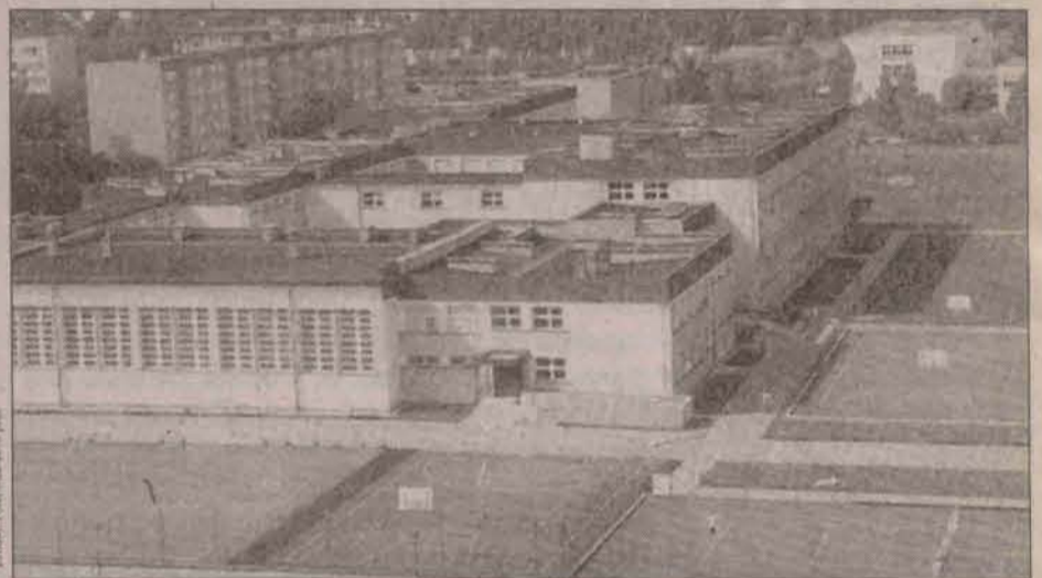
Zespół Szkół w Polkowicach

Szkolnictwo, tak jak wszystkie budżetowe instytucje, nie miały łatwego życia w pierwszych latach demokracji. Pieniądzy brakowało przecież nie tylko na służbę zdrowia, kulturę i oświatę, ale także na wojsko i policję. W tej sytuacji sukcesem było powołanie do życia w Polkowicach Zespołu Szkół Ogólnokształcących. Jego budowa ukończona została w 1992 roku.