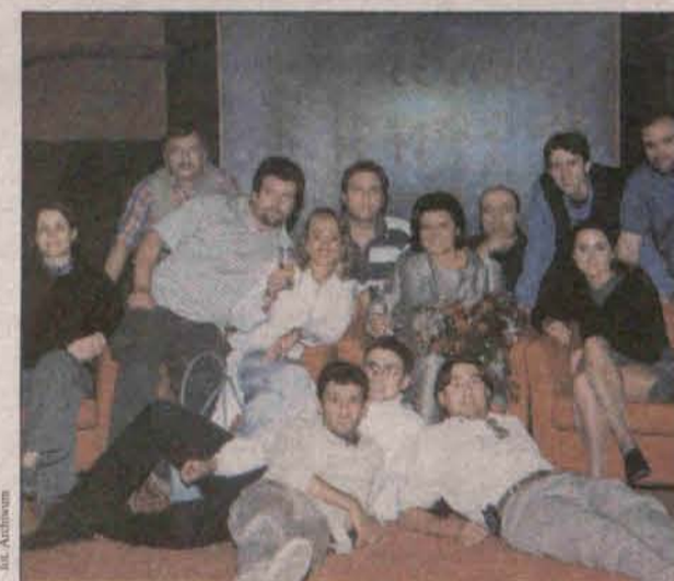
Ekipa „Zerwanych Więzi”

20 lat zupełnie przypadkowo. W lokalnej TV brakowało akurat operatora. Zgłosił się i... tak się zaczęła największa przygoda jego życia. Szybko został dostrzeżony, bo już trzy lata temu, kiedy poszedł do szkoły operatorów filmowych.