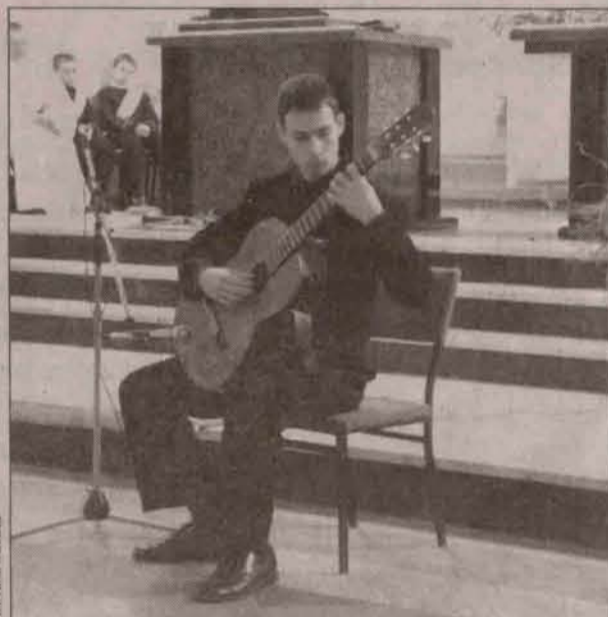
Podczas recytacji wierszy uczeń Państwowej Szkoły Muzycznej II stopnia wykonywał utwory Bacha i Mozarta

W minioną niedzielę polkowiczanie obchodzili jego święto.