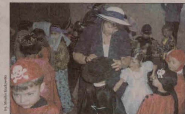
Ostatnie przygotowania do balu

sta zapraszał dzieci do udziału w sztuczki. Po magii przyszedł