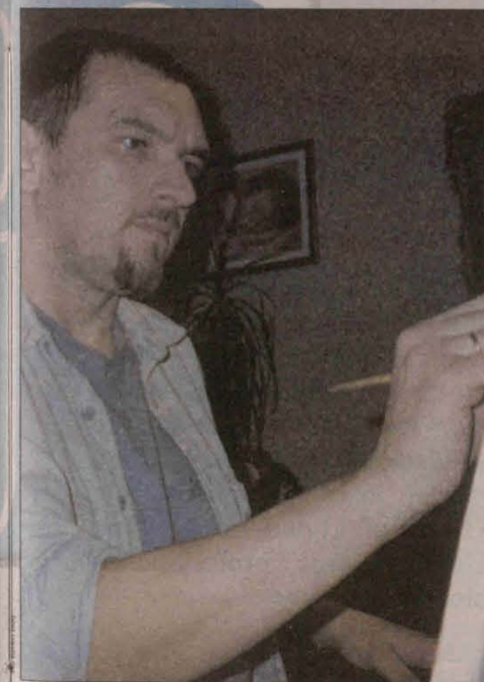
Praca artysty wymaga dużego skupienia

„Zyga” wystawiał swoje prace w ośrodku kultury, choć jak sam mówi „stanowiły tylko tło” dla odbywającej się tam impre-