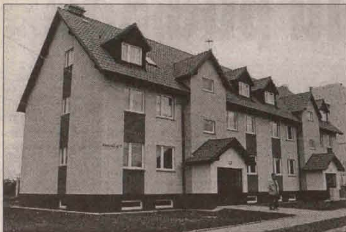
Fot. WINCENTY KOŁODZIEJSKI

JAWOR W ubiegły piątek lokatorzy pierwszego w mieście budynku Towarzystwa Budownictwa Społecznego w Kamiennej Górze otrzymali klucze do mieszkań. Niektórzy, tak jak państwo Horszowscy, będą chcieli spędzić święta już pod własnym dachem.