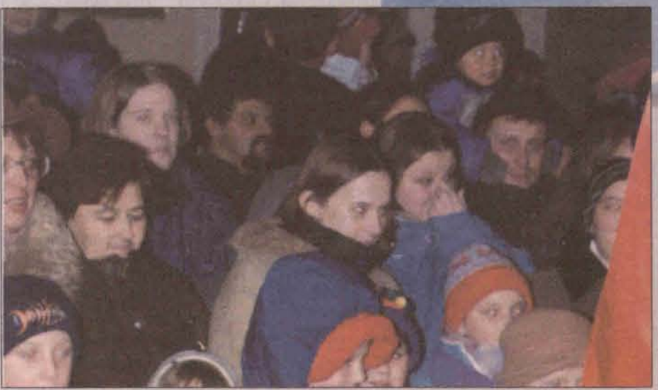
„Mały Sylwester” cieszył się dużym powodzeniem