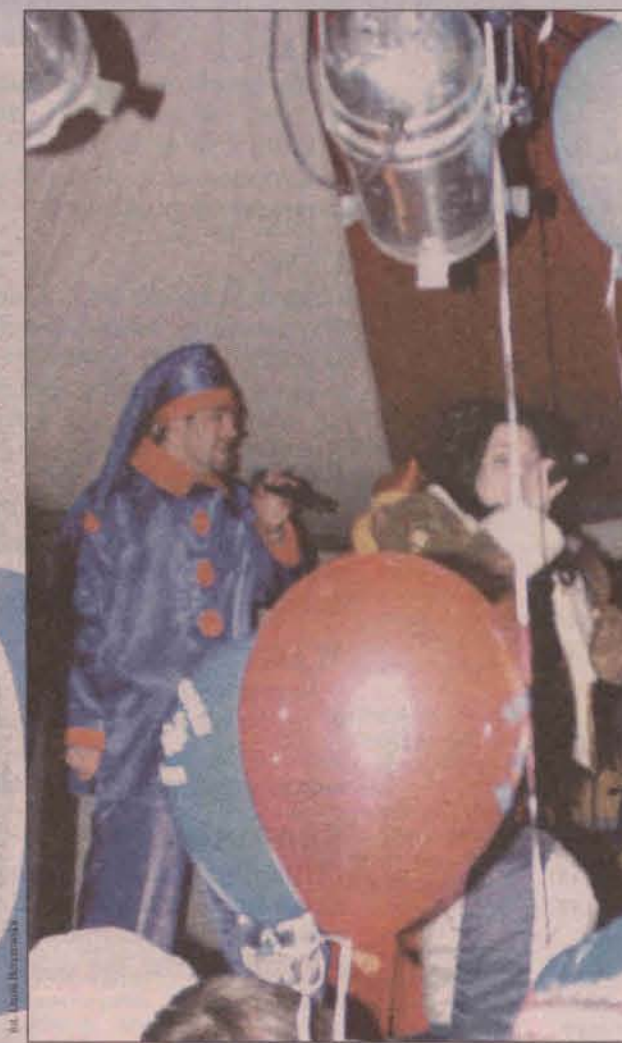
Program artystyczny przygotowany z myślą o najmłodszych

rosłych. Publiczność dopisała - szkolne boisko było zapelnione. „TIA MARIA” tym razem zaprezentował program artystyczny dla młodzieży i dorosłych. Ci, którzy zgłodnieli podczas zabawy mogli skorzystać z przygotowanej przez organizatorów małej gastronomii. - Wspólnie ze znajomymi bawimy się na sylwestrze zorganizowanym przez Zespół Szkół, ale przyszliśmy tu z butelką szampana aby wspólnie ze wszystkimi obecnymi