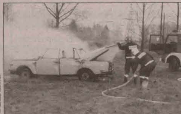
Połączone siły strażaków dają najlepsze efekty

Wzwiązku z akcją „Podaruj dzieciom słońce” prowadzoną przez Telewizję Polsat, Komenda Powiatowa Państwowej Straży Pożarnej w Polkowicach prowadzi akcję „Żyj bezpiecznie”. Wśród dzieci i młodzieży z terenu powiatu polkowickiego prowadzone są prelekcje i pokazy technik ratownictwa drogowego przy użyciu narzędzi hydraulicznych tzw. szczęk życia.