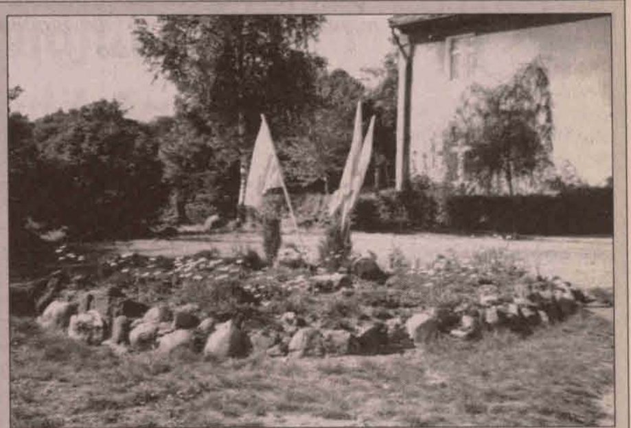
W konkursie ogłoszonym przez starostwo powiatowe na najlepszą inicjatywę społeczną trzecie miejsce zajęła wieś Jakubów, gmina Radwanice