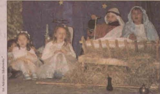
Jasełka w Radwanicach zostały nagrodzone gromkimi brawami

ria wykonana przez pracowników przedszkola i charakterystyka aktorów (zasługa rodziców) dodała blasku przedstawieniu. Zaproszeni goście złożyli sobie wzajemne życzenia łamiąc się opłatkiem, a oprócz gry aktorskiej najmłodszych wysłuchali koled w wykonaniu zespołu ludowego z Radwanic. Nie obyło się również bez małego poczęstunku. Adrianna Jakubowska