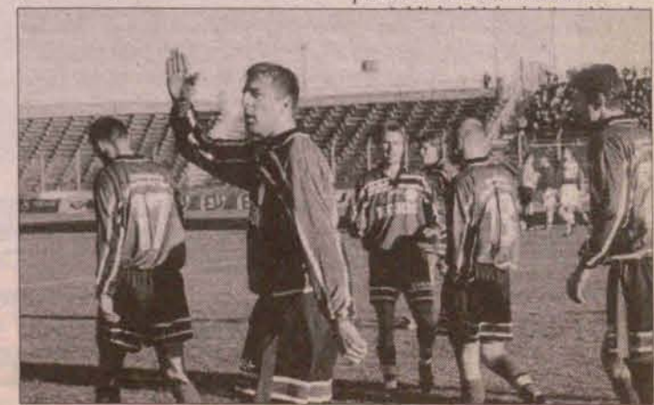
Dla Zagłębia 2000 rok był udany.

• Drużyna Legnickiego Towarzystwa Ringo została drużynowym mistrzem Polski. Legniczanie w finale pokonali 4:3 WTR Warszawa.