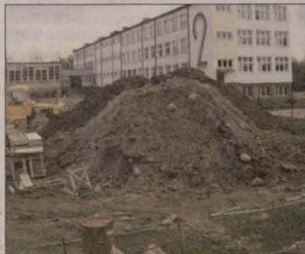
Budowa nowej sali gimnastycznej przy Szkole Podstawowej nr 2

Pełna wersja tekstu ukazała się w listopadowym numerze pisma „Dolnośląska Panorama Samorządowa”