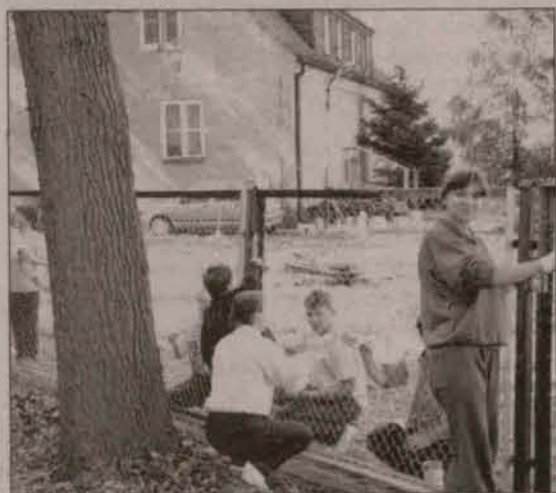
W pracę zaangażowani byli wszyscy

- Wprowadzając język niemiecki dla dzieci starszych i młodszych oraz rytmikę, chcę, by szanse edukacyjne były mniej zróżnicowane - powiedziała Be-