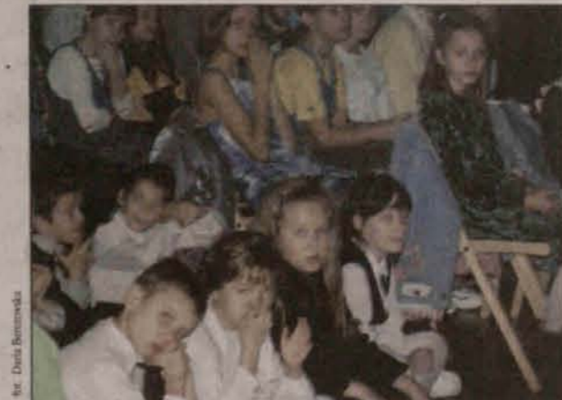
W oczekiwaniu na swoją kolejność.

Polkowicki Ośrodek Kultury Sportu i Rekreacji wspólnie z Zakładem Innowacji Budowlanej „ZIB” M. Jankowski zorganizowali czwartą edycję Powiatowego Konkursu Recytatorskiego „Srebrna Muza”, którego jednym z celów było pobudzenie wra-