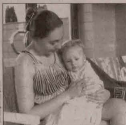
Chwila dla rodziny

Aquapark przygotowuje wielką gratkę dla rodzinnych teamów. Już w następną sobotę, 9 grudnia, będzie można wraz z rodzicami, al-