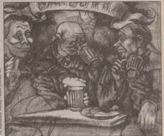
A po pracy... odrobina zabawy

Tekst powstał w oparciu o książkę „Górnicy Stan” pod redakcją Doroty Simonides