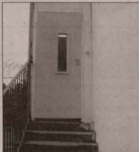
Noclegownia przy u. Spokojnej. Za tymi drzwiami ludzie bezdomni mogą znaleźć schronienie.

W bloku przy ulicy Skrzetuskiego nr 33, od pewnego czasu na klatce schodowej nocuje mężczyzna. Nie stwarza on żadnych kłopotów mieszkańcom. - Nie chodzi nam o to, żeby tego człowieka wygonić jak psa na mróz. Chcemy mu pomóc - mówi przejęta mieszkanka bloku. - Nie zakłóca ciszy nocnej, nie pije alkoholu, ani nie brudzi na klatce - dodaje. Wielu mieszkańców martwo się losom mężczyzny. Żał im patrzeć jak zbiera wycieraczki z czwar-