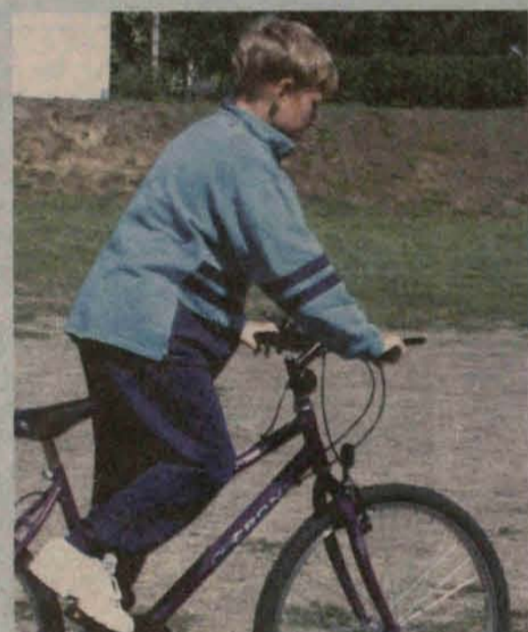
Przejechał na dwóch kółkach