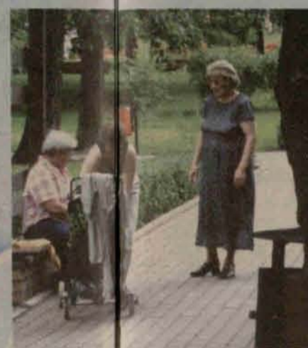
W mieście parku (został wzięty spacerownik)