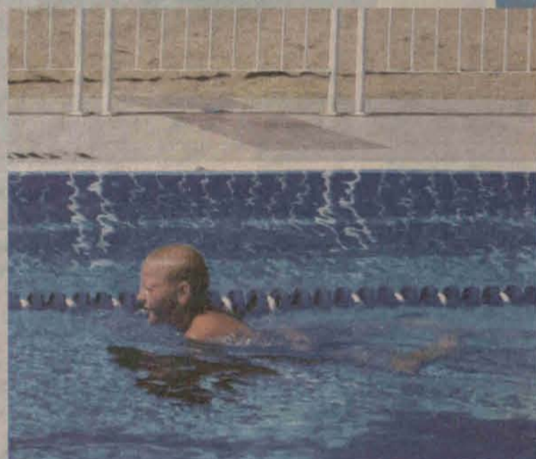
Zanim dzień - basen