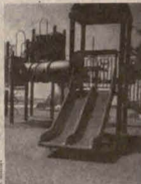
Jedną z propozycji

We wrześniu warszawskie biuro architektury kra-