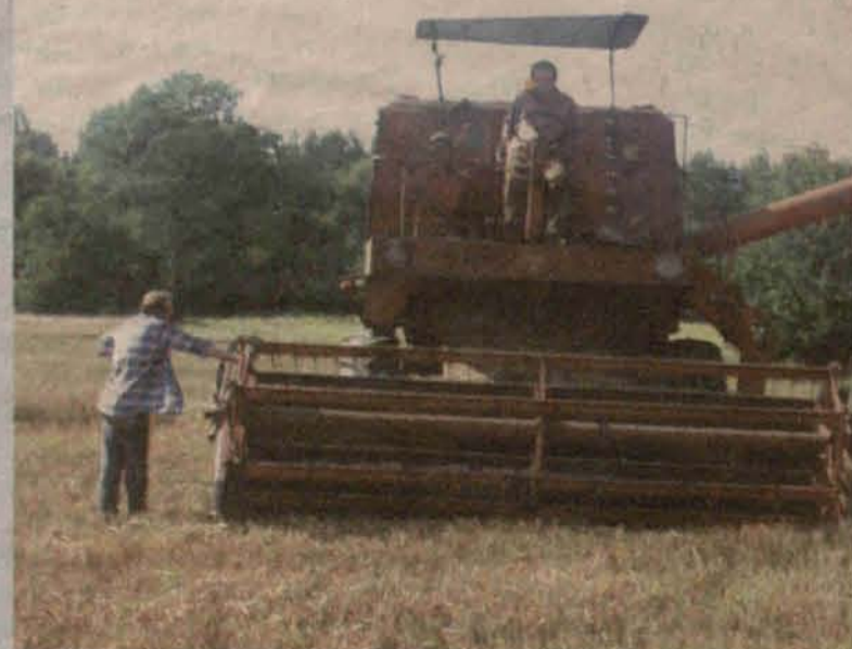
Długo wyciekający obrotki, kłopoty podłozne