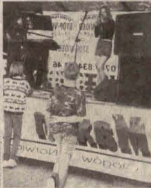
Festyn w Jaczowie