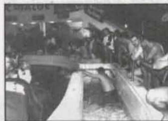
Mistrzowskie ślizgi str. 2