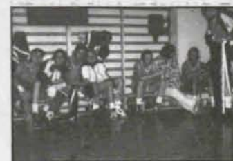
Po lidze str. 10