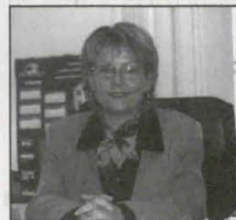
Trzy pytania do... str. 4