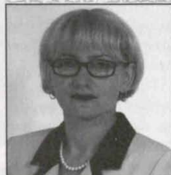
Znani prywatnie str. 6