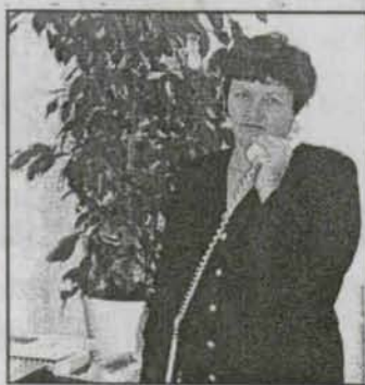
Trzy pytania do... str. 4