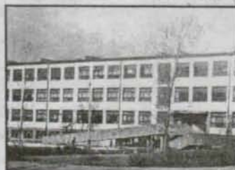
Rok szkolny rozpoczęty