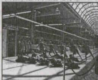
Volkswagen już produkuje str. 6