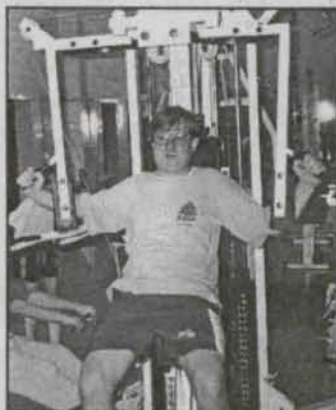
Znani prywatnie str. 6