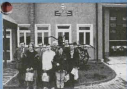
„Pożarnicza wiedza” - str. 4