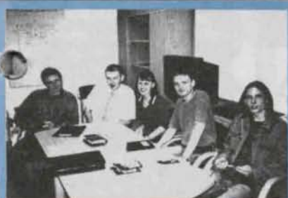
Sejmik w AQUAPARKU - str. 12