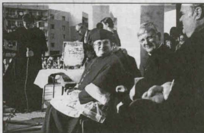
Nie łudźcie się i tak ja wygram...