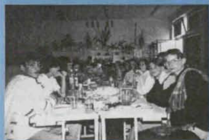
„Już za ... matura” - str. 6