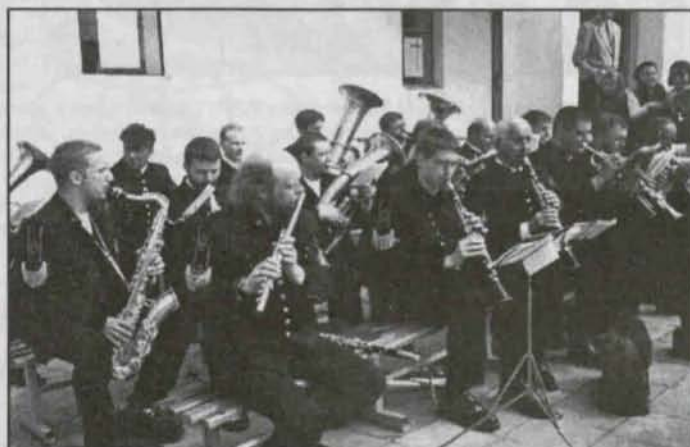
Czas umiała orkiestra górnicza.