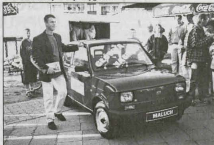
Maluchem na Miedzianą...