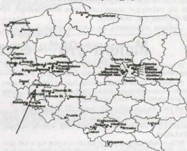
Atrakcyjność inwestycyjna małych miast Klasa A - miasta najatrakcyjniejsze

Polkowice znalazły się w grupie A - oznaczającej miasta najatrakcyjniejsze - pod względem infrastruktury technicznej (m.in. rozwój telefonizacji, budownictwo mieszkaniowe) oraz infrastruktury związanej z biznesem (rozwój sieci bankowej oraz instytucji obsługujących życie gospodarcze). (kas)