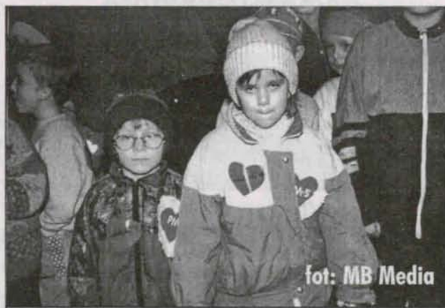
Najmłodsi uczestnicy Biegu Walentynkowego na moment przed swoim pierwszym startem.

Najważniejsze, że pomyślano o przedszkolakach, dla których mamy nadzieję nie będzie to pierwsza i zarazem ostatnia impreza. Pomyślano także o herbacie, którą zmarzniętym biegaczom rozdawały sympatyczne harcerki. Im, jak również policji, straży miejskiej i POKSiR-owi organizatorzy składają serdeczne podziękowania za pomoc w organizacji imprezy.