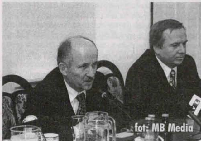
Minister Skarbu Emil Wąsacz podczas konferencji prasowej w Polskiej Miedzi.

Podczas niedawnej wizyty w Lubinie minister Skarbu Państwa Emil Wąsacz zapowiedział dalszą prywatyzację KGHM Polska Miedź SA, poprzez znalezienie dużego inwestora strategicznego, który miałby około 15 procent akcji miedziowego holdingu.