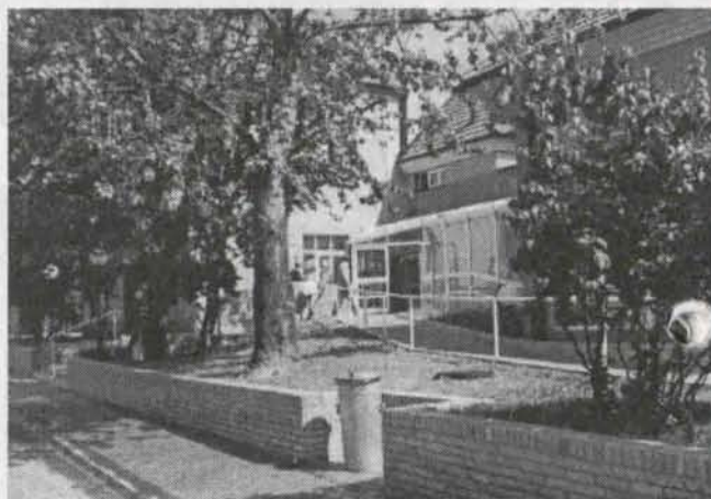
Ośrodek Opieki Paliatywnej przy ul. Lipowej w Polkowicach

Jednak dotychczasowy przebieg i zakres świadczonych usług wskazują na potrzebę utworzenia oddziału pielęgnacyjno-paliatywnego. Z drugiej strony fakt, że opieka paliatywna w Polkowicach istnieje w takiej, a nie innej formie oraz ma szansę na dalszy rozwój świadczy o dojrzałości społecznej władzy - takie jest zdanie pracowników ośrodka.