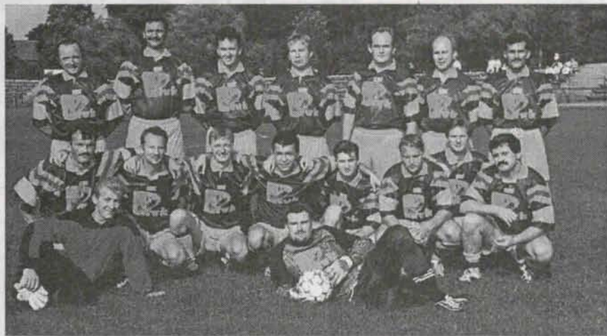
Na zdjęciu telewizyjna drużyna w całej krasie.

Wszyscy chętni kibice mogli poczęstować się pysznym, jubileuszowym tortem.