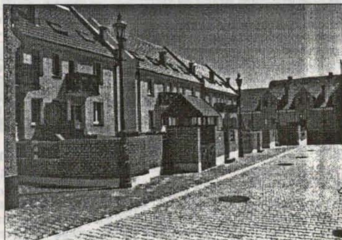
Tytuł „Budowy Roku” dla polkowickiej Starówki to jedno z najpoważniejszych wyróżnień, jakie spotkały Polkowice w ubiegłym roku.

15 marca Szkoła Podstawowa Nr 4 otrzymała imię Aleksandra Kamińskiego. Ceremonia nadania imienia odbyła się w dniu 17 rocznicy śmierci druha „Kamyka”. Honorowymi gośćmi uroczystości byli koledzy i towarzysze broni Aleksandra Kamiń-