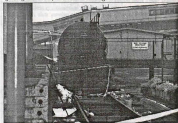
Budowana będzie nowa bocznica kolejowa na której oczekiwac będą wagony cysterny z kwasem siarkowym.

„Jest to spore przedsięwzięcie, w skład którego wchodzi kilka obiektów budowlanych, częściowo łączonych z halami ZWR jak również spora ilość różnego rodzaju urzą-