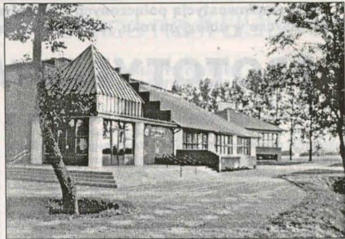
Nowy budynek szkoły w Jędrzychowej był miejscem wojewódzkiej inauguracji roku szkolnego.

Skład komisji wyborczych do spraw referendum będzie inny niż podczas wyborów.