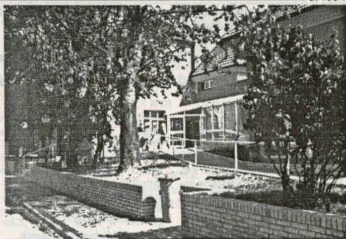
Stołówka w OPS jest już samodzielna