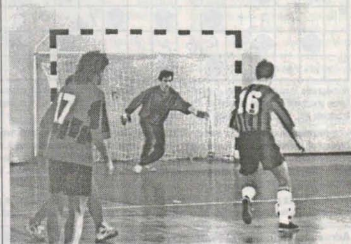
Takich sytuacji podbramkowych nie zabraknie z pewnością i w niedzielnych rozgrywkach.

W ubiegłą niedzielę w Biełsku Białej reprezentacja Cuprum Polkowice zainaugurowała rozgrywki I ligi halowych piątek piłkarskich. Z nieukrywaną radością informujemy, że nasi piłkarze zdobyli w dwóch spotkaniach dwa punkty wygrywając 1:0 i przegrywając 1:3. W najbliższą niedzielę w sali Zespołu Szkół podejmować będą „Energetyka” Jaworzno. Początek spotkania o godzinie 14 00 .