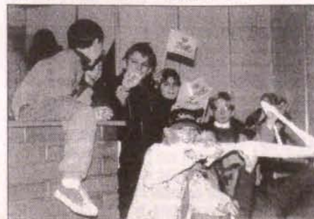
Z targowych gadżetów najbardziej cieszyli się dzieci.