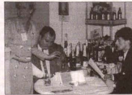
Bogata oferta firmy „Marco” dostrzeżona została przez targowe jury.