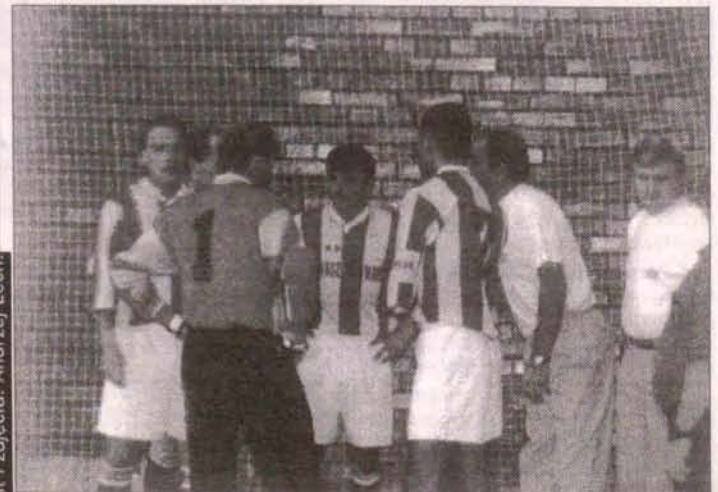
Na zdjęciu fragment spotkania halowej piłki nożnej.

Miejmy nadzieję, że w kolejnym spotkaniu, które rozegrane zostanie w najbliższą niedzielę w Zespole Szkół o godzinie 12.00 będzie dużo lepiej. Tym razem przeciwnikiem „miedziaków” będzie PA Nova Gliwice. Pamiętajmy, że w ekstraklasie halowych piłkarskich rozgrywane są dwa spotkania; mecz i rewanż.