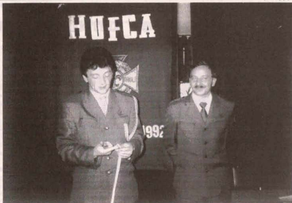
Szesnastu harcerskich instruktorów spotkało się w Szkole Podstawowej nr 2 aby powołać nowe władze Komendy Hufca Polkowickiego.

Nowoczesną strażnicę OSP i Stację Ratownictwa Górniczego w Sobinie odwiedzili w ubiegły piątek, 17 listopada, Komendant Wojewódzkiej Państwowej Straży Pożarnej i Komendant Rejonowy z Leszna oraz Dowódca Jednostki Ratowniczo-Gaśniczej ze Wschowy. Goście zjechali również na „dół” w ZG „Lubin”.