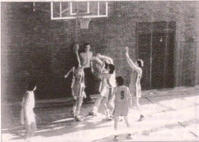
Na zdjęciu fragment spotkania trzecioliigowego Orła Polkowice.

Zdecydowanie wśród swoich rywali przewodzą kadetki Orła, które w ostatniej kolejce pokonały Szprotawie Szprotowa 88:68. Młodziczki zaś są na trzecim miejscu.