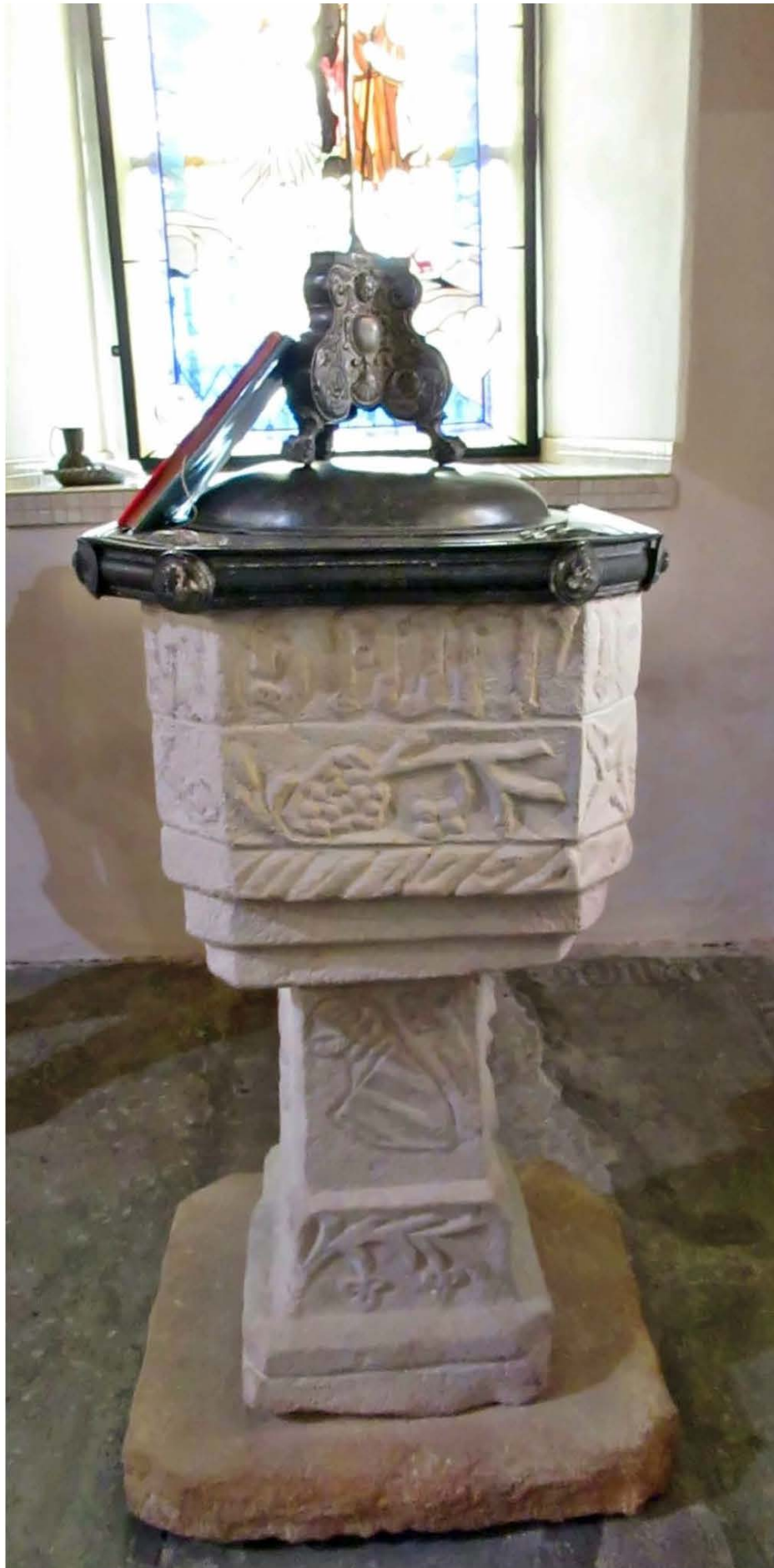
Herb hrabiów Schaffgotschów